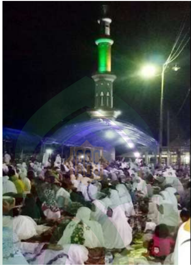
Foto Acara Maulid saat malam hari