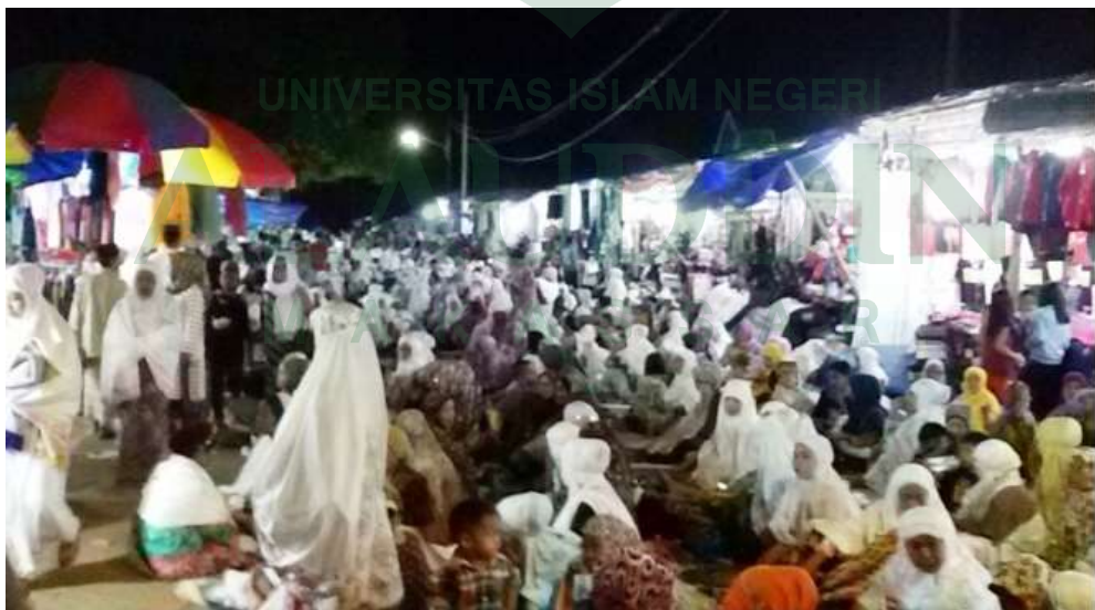
Foto Acara Maulid saat malam hari