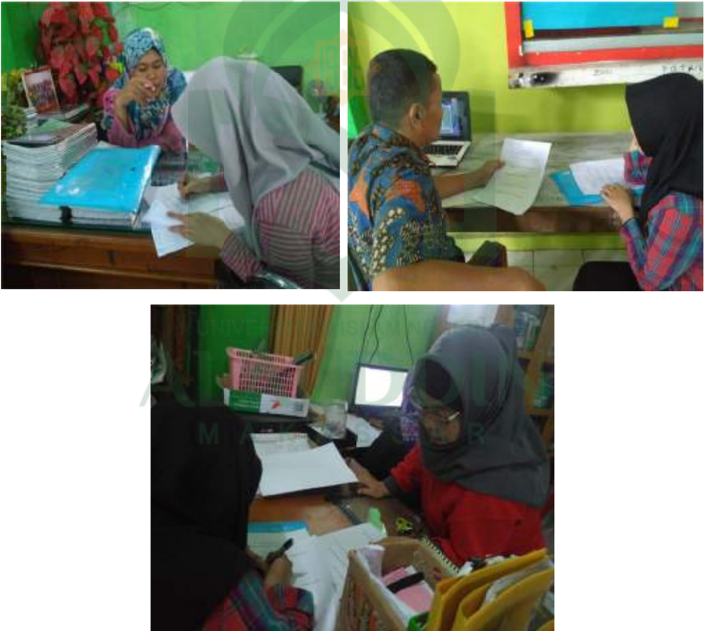
Gambar 1 Wawancara dengan Informan