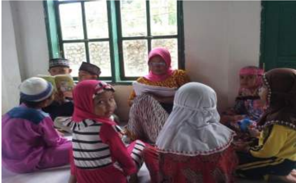
Gambar 9. Suasana Setoran do'a-do'a harian di TK-TPA Tauhidal Islam Dusun