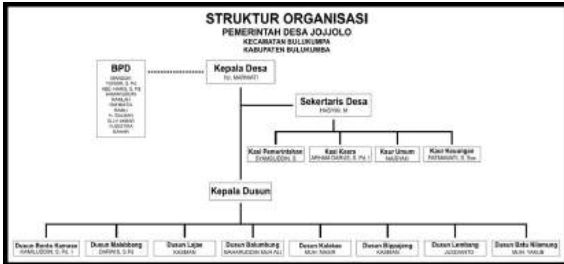
Gambar 4.1. Struktur Organisasi Pemerintah Desa Jojjolo

Sumber data : Profil Desa Jojjolo Tahun 2018