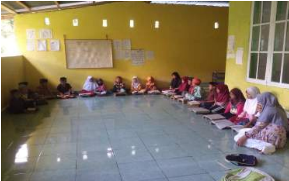
Gambar 8. Suasana proses belajar mengajar di TK-TPA Nurul Akbar Dusun Lajae Desa Jojjolo