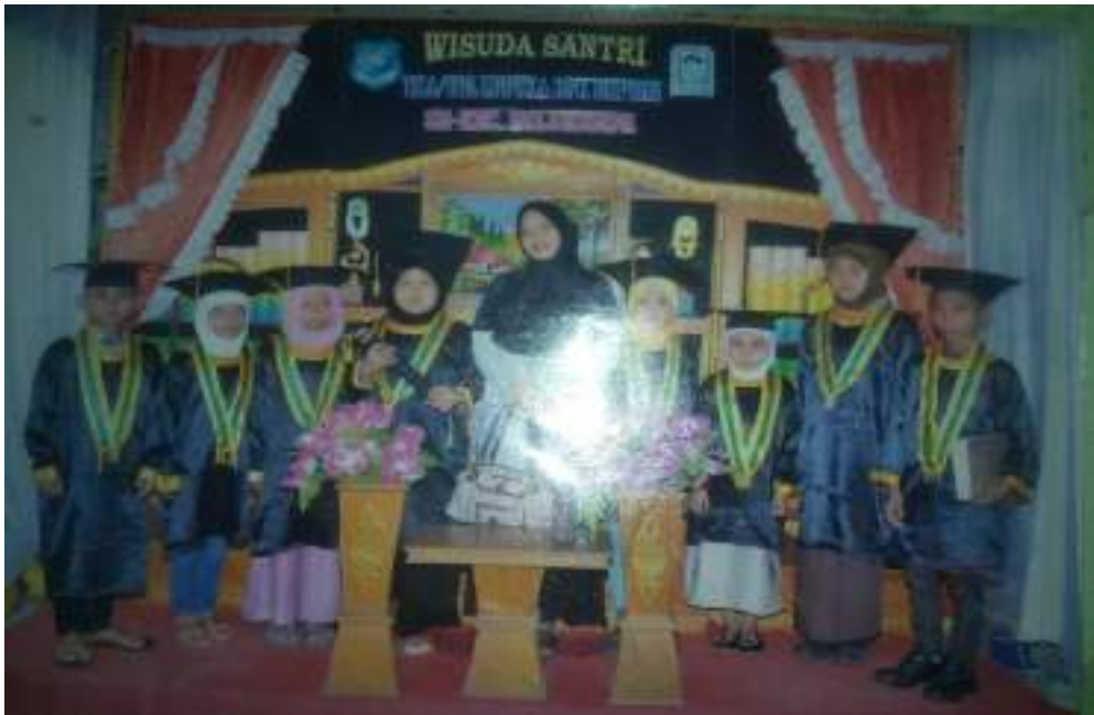
Gambar 10. Foto wisuda santri TK TPA Nurul Akbar Dusun Lajae Desa Jojjolo