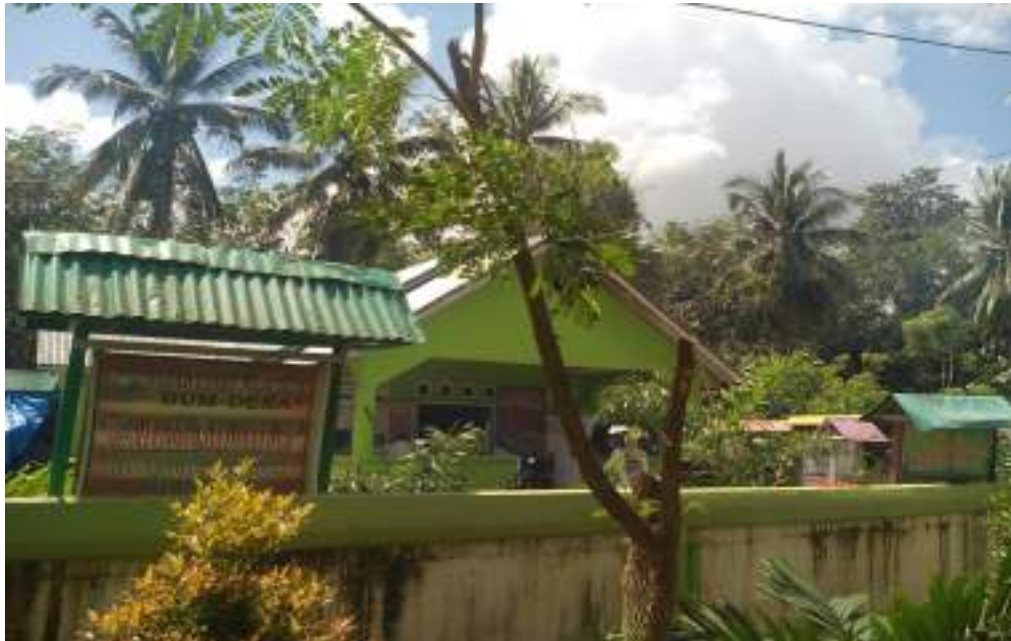
Gambar 7. Kantor Desa Jojjolo Kecamatan Bulukumpa Kabupaten Bulukumba