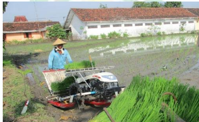
Gambar 4 mesin tanam padi

Rice transplanter teknologi Korea, Taiwan maupun China yang dinilai lebih terjangkau dari segi harga, saat ini telah dimiliki dan mulai digunakan di beberapa daerah di Indonesia, termasuk di Sulawesi Selatan bersamaan teknologi pembibitan padi hemat lahan. Rice transplanter adalah jenis mesin penanam padi yang dipergunakan untuk menanam bibit padi yang telah disemaikan pada areal khusus dengan umur tertentu, pada areal tanah sawah kondisi siap tanam, mesin dirancang untuk bekerja pada lahan berlumpur (puddle). Oleh karena itu mesin ini dirancang ringan dan dilengkapi dengan alat pengapung.