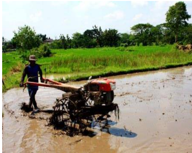
Gambar 2 traktor tangan