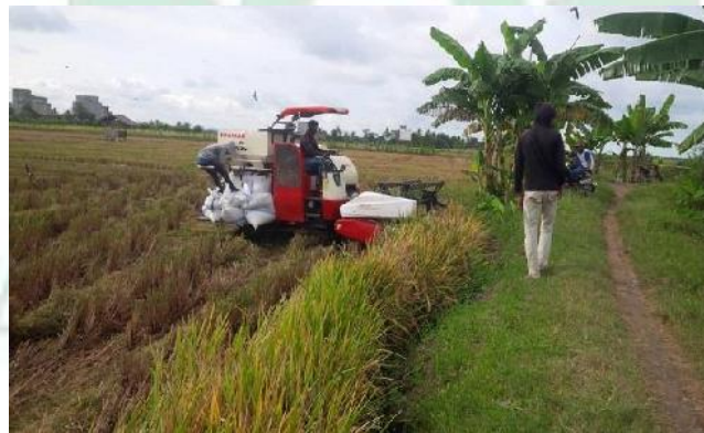
Gambar 6 mesin panen combine harvester

Pemahaman tentang Combine Harvester sangat penting dalam pengelolaan pertanian tanaman pangan modern, dengan mengetahui bagian mesin dan cara kerja serta kinerja, pengelolaanya dapat direncanakan dan mengatur penggunaan combine harvester dengan efisien dan ekonomis. Dengan demikian akan mendukung proses budidaya keseluruhan secara mekanis dan mempunyai keuntungan.