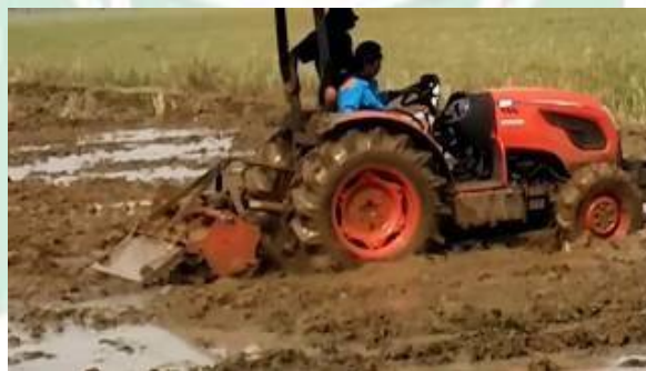
Gambar 3 traktor roda empat