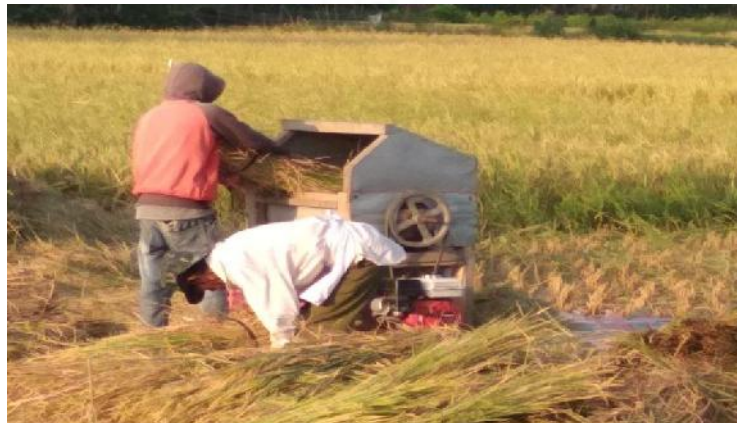
Gambar 5 gambar mesin dross

Dengan mesin perontok padi yang sekarang, operasional mesin cukup sederhana, cukup dengan memegang bagian ujung gagang jerami padi. Kemudian ditempelkan ke dalam gerigi perontok padi, maka padi akan terontok sempurna. Mesin ini disediakan juga tempat menaruh batang padi yang siap dirontokkan, sehingga jarak waktu antara perontokan pengambilan bahan baku cepat.