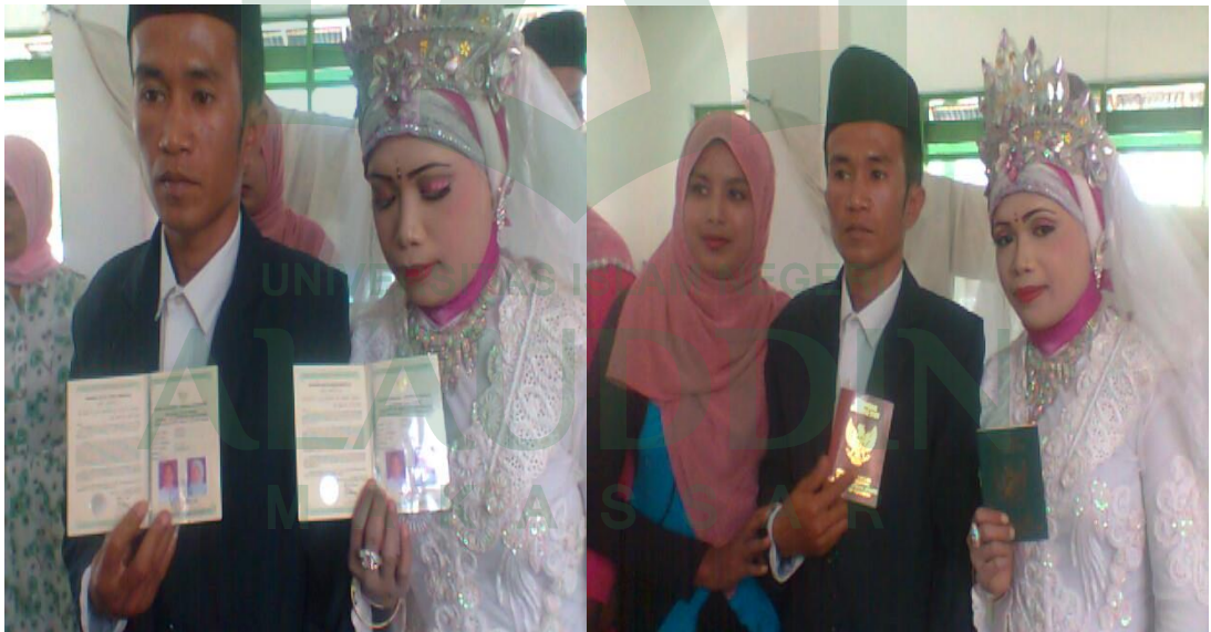
Gambar 9 dan 10 : Buku Nikah ini sudah di urus sebelum acara Ijab Kabul di laksanakan begitulah pernikahan sekarang, Prosesi Akad Nikah.