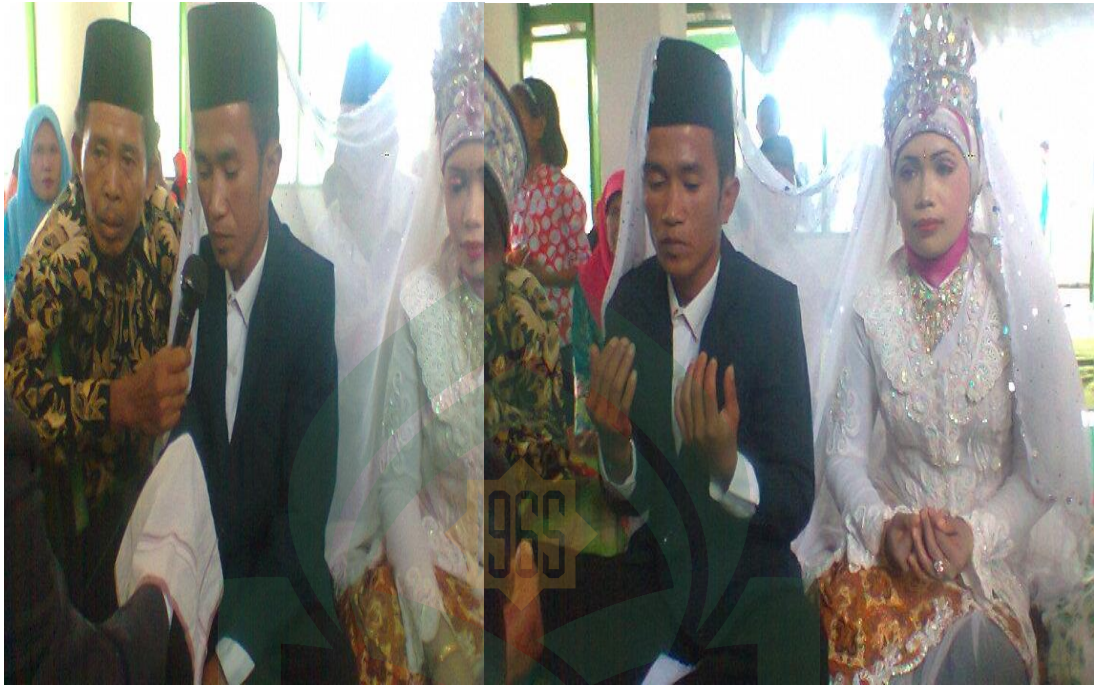
Gambar 7 dan 8 : Letak Budaya Islam yaitu pada saat Ijab Kabul dan letak budaya lokalnya adalah pakaian pengantin perempuan yang menggunakan baju tradisional