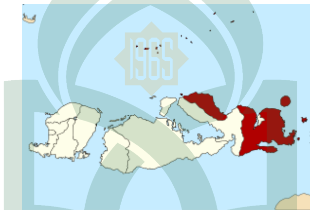
Gambar 1. Peta Kabupaten Bima

Kabupaten Bima adalah sebuah kabupaten di Nusa Tenggara Barat, Indonesia. Ibu kotanya ialah Woha. Secara astronomi Kabupaten Bima terletak pada Koordinat: 118^{\circ}44' – 119^{\circ}22' BT dan 8^{\circ}8' – 8^{\circ}57' LS. Kabupaten Bima berdiri pada tanggal 5 Juli 1640 M, ketika Sultan Abdul Kahir (La Kai) dinobatkan sebagai Sultan Bima I yang menjalankan Pemerintahan berdasarkan Syariat Islam. Peristiwa ini kemudian ditetapkan sebagai Hari Jadi Bima yang diperingati setiap tahun.