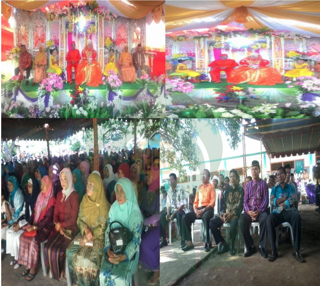
Gambar 11 dan 12 : Letak Budaya Islam pada gambar di atas adalah dari pakaian dan suasana acara yang penuh dengan keIslaman. Acara Resepsi/ Jambuta/ Tekarane'e