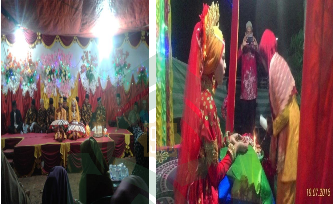
Gambar 1 dan 2 : Letak Budaya Islam pada gambar di atas adalah bacaan dzikir dan pakaian pengantin yang mencerminkan keislaman.