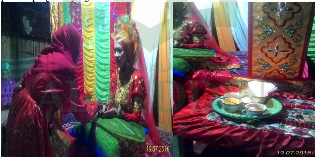
Gambar 3 dan 4 : Letak Budaya Lokal pada gambar di atas adalah pada saat para undangan meletakkan daun pacar di tangan, percikan air dan dilempari beras kuning pada pengantin. Acara Malam Kapanca atau Pacar