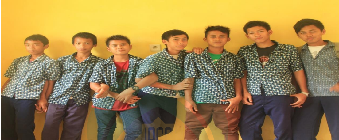
Gambar IX: Asrama santri