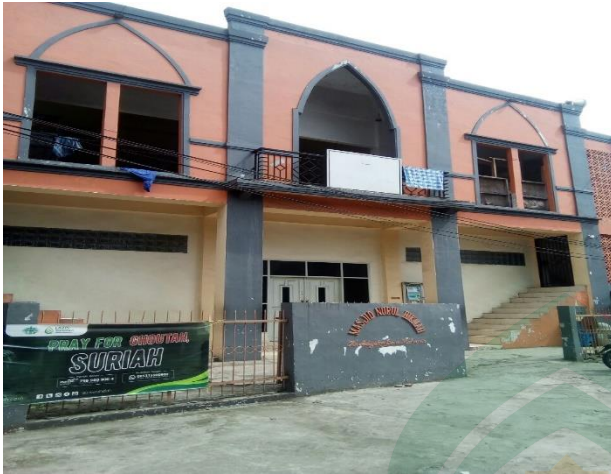
Kantor DPD Wahdah Islamiyah Makassar terlihat dari depan