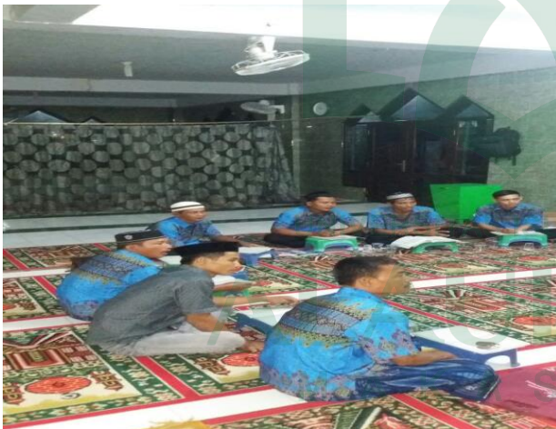
Peserta Dirosa memperhatikan materi Dirosa yang sedang dipelajari.