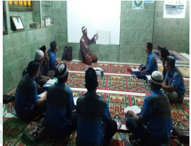
Pengajar Dirosa menjelaskan materi yang sedang dipelajari