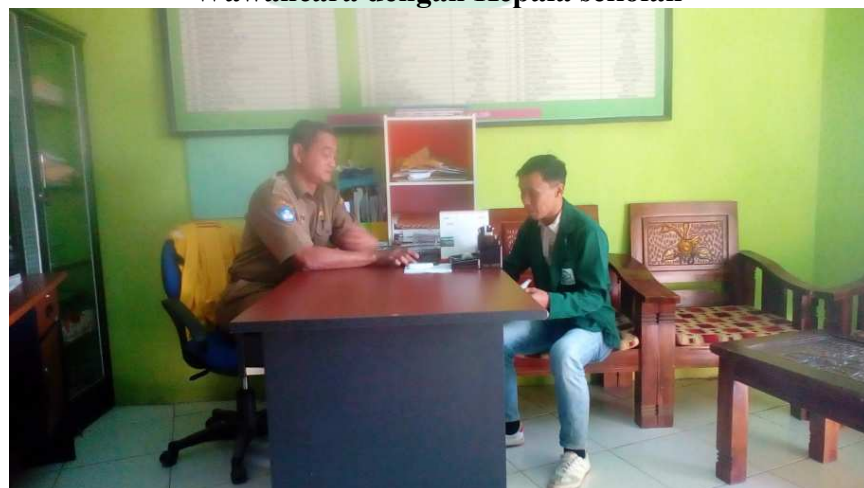
Gambar 2 Wawancara dengan Kepala sekolah