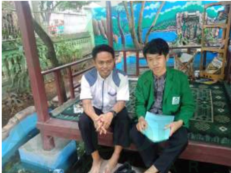
Wawancara, bersama tokoh agama dan akademisi