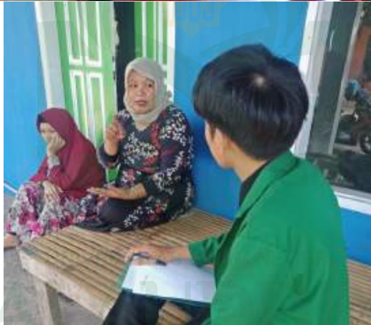
Wawancara dengan Informan selaku penerima anjak piutang terhadap praktik Arisan.