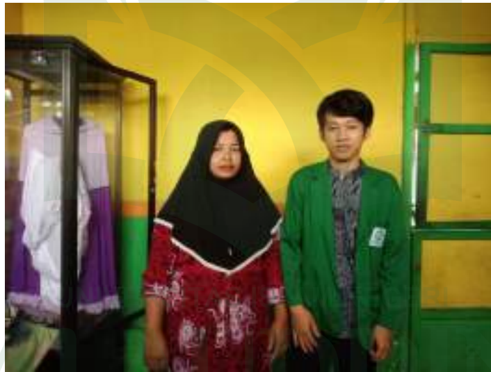
Wawancara dengan informan selaku pegalih anjak piutang terhadap prakti arisan.