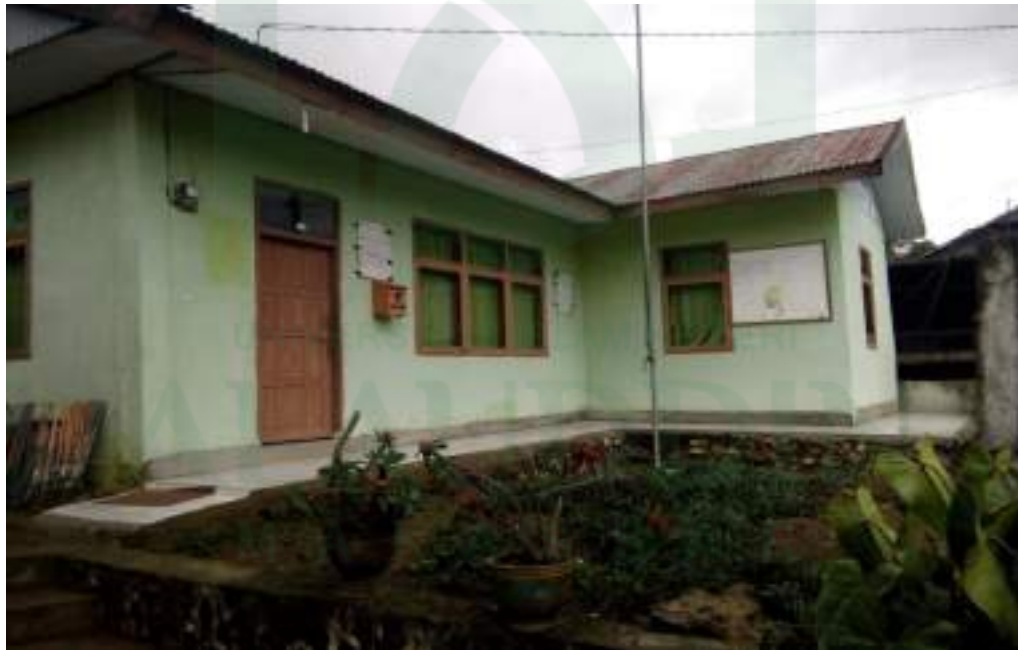
Foto kantor Desa di Desa Banti Kecamatan Baraka Kabupaten Enrekang