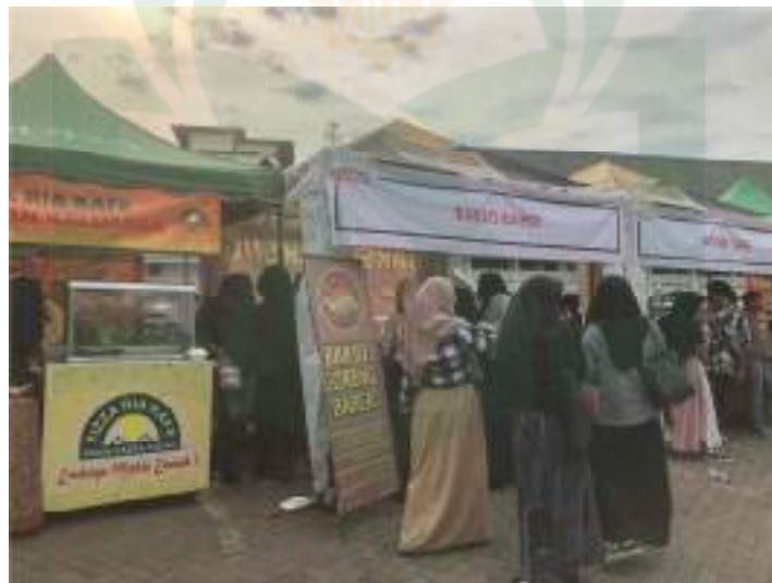
Gambar 4.5 Foto stand Bakso Goreng Baper saat mengikuti event

“Setiap ada acara-acara di Makassar, pasti kita selalu usahakan untuk hadir dan mendirikan stand Bakso Goreng Baper. Karena dengan cara itu produk dari Bakso Goreng Baper banyak yang bisa melihat langsung dan bisa menilai keunggulan atau kelebihan dari produk Bakso Goreng Baper dengan produk yang lainnya. Seperti Event Grabfood yang di adakan langsung oleh Grab yang ada di Phinisi Point, pada saat itu stand Bakso Goreng Baper penuh oleh pengunjung dan pastinya omset bertambah.” 5