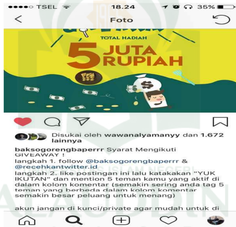
Gambar 4.8 Salah satu contoh strategi promosi melalui mulut ke mulut dari intstagram Bakso Goreng Baper.

“Ketika kita ingin memperkenalkan produk yang kita miliki, yang harus kita lakukan adalah mempromosikan produk kita, salah satu cara promosinya yaitu, memberikan informasi kepada teman-teman atau dari mulut ke mulut dari instagram. Karena dengan dengan cara seperti itu informasi mengenai produk yang kita miliki jauh lebih cepat tersebar.” 9