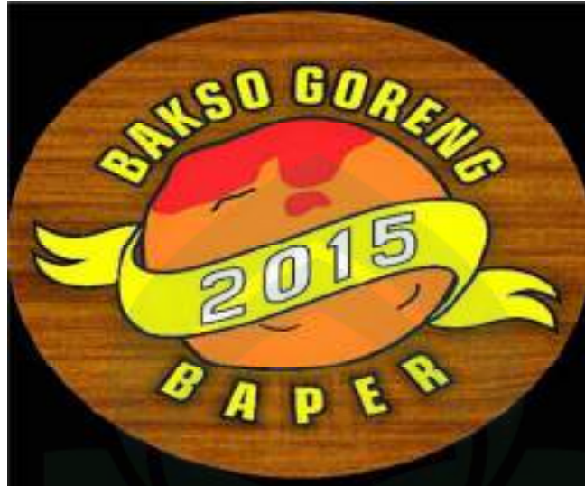
Gambar 4.2 : Logo Bakso Goreng Baper