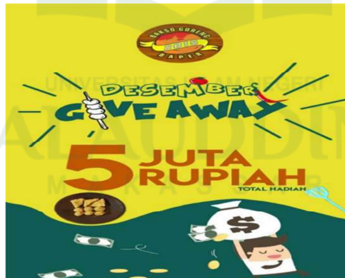
Gambar 4.6 Iklan event yang dibuat oleh owner Bakso Goreng Baper.

“Bakso Goreng Baper melejit ketika merumuskan event Like Foto di tahun 2015 di Instagram, event ini salah satu formula kegiatan yang dirumuskan oleh owner bakso goreng baper dalam meningkatkan pendapatan penjualannya, progres event ini yaitu pelanggan berfoto di depan grobak atau both atau semua hal yang terkait dengan Bakso Goreng Baper, lalu mengirim foto tersebut di akun official Bakso Goreng Baper, pihak owner official wajib memposting foto pelanggan yang berpartisipasi mengikuti event, penilaian dalam event ini yaitu melihat jumlah like foto pelanggan yang di posting dalam akun official, pelanggan yang terbanyak mendapatkan like , maka ialah pemenang dalam event ini. Event ini cukup sukses dan berdampak positif dalam peningkatan penjualan, hasil event tersebut membuat akun official instagram Bakso Goreng Baper memiliki followers terbanyak dan konsumen yang pesan melalui instagram juga membludak”. 6