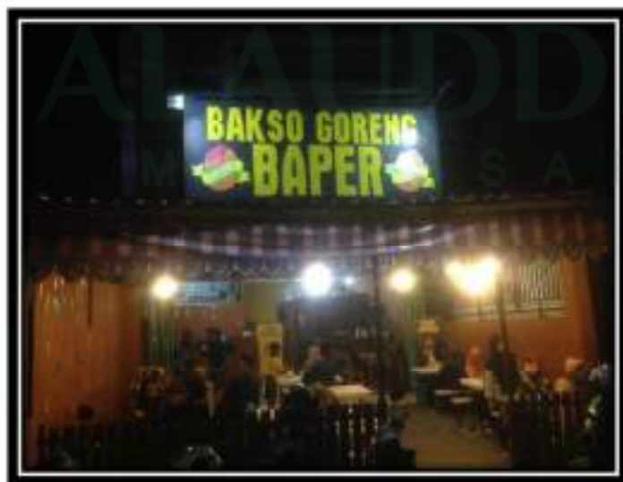
Gambar 1.1 Foto Bakso Goreng Baper

Dengan memasukkan unsur teknologi ke dalam bisnis, maka akan melengkapi strategi pemasaran, dari pemasaran secara konvensional, berkembang menjadi pemasaran sistem online. Dengan perpaduan strategi offline dan online tersebut maka akan meningkatkan daya saing Usaha Kecil dan Menengah. Namun, mengingat berbagai keterbatasan yang dimiliki. Maka perlu dilakukan beberapa kajian teknologi, sehingga akan diperoleh hasil apakah teknologi tersebut mudah digunakan dan akan lebih berguna untuk meningkatkan kinerja dan produktivitas, termasuk Bakso Goreng Baper yang ada di Gowa.