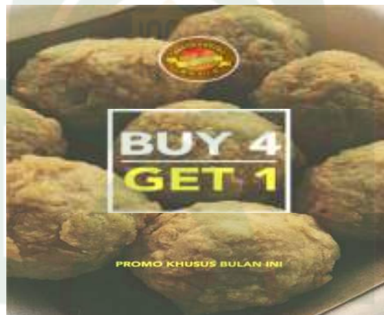
Gambar 4.7 Promo Bakso Goreng Baper melalui Instagram.

“Salah satu pembedanya Bakso Goreng Baper dengan bakso lain, pada saat memperingati hari besar Bulan Suci Ramadhan. Salah satu contoh pada saat setiap memasuki awal bulan Suci Ramadha,. Di hari itu bisa di berikan diskon untuk semua produk makanan dan minuman yang ada di semua outlet Bakso Goreng Baper. Dan pastinya pasti banyak yang berminat untuk berbelanja karena mendapat discount. 7 ”