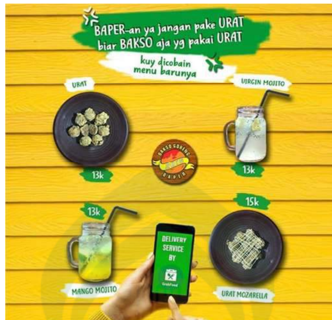
Gambar 4.3 Pemesanan melalui GRABFOOD

Media Sosial merupakan salah satu strategi pemasaran Bakso Goreng Baper yang paling menguntungkan dan paling sering digunakan dalam mempromosikan produknya. Seperti yang diungkapkan oleh salah satu pegawai dari Bakso Goreng Baper yang bernama Galang, sebagai berikut: