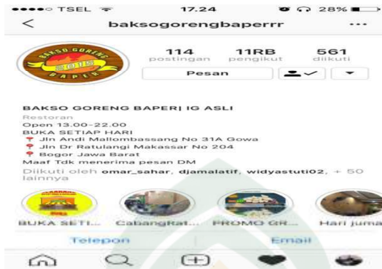
Gambar 4.4 Profil akun instagram Bakso Goreng Baper

Berdasarkan hasil wawancara, peneliti mengasumsikan bahwa media sosial adalah salah satu strategi Bakso Goreng Baper dalam memasarkan produknya. Media sosial seperti Instagram merupakan wadah atau tempat yang paling tepat untuk memasarkan produk saat ini, mengingat hampir semua kalangan menggunakan media sosial. Kecepatan dan kemudahan dalam mengakses informasi dan berita melalui media sosial, memudahkan Bakso Goreng Baper untuk memperkenalkan model produknya sekaligus untuk mempromosikannya. Selain itu, media sosial memungkinkan Bakso Goreng Baper untuk berkomunikasi dengan pelanggan, dan calon pelanggan. Media sosial memberi identitas kepada brand atau merk yang dipasarkan, sekaligus membantu Bakso Goreng Baper untuk menyebarkan atau menginformasikan produk Bakso Goreng Baper dengan cara yang santai dan komunikatif.