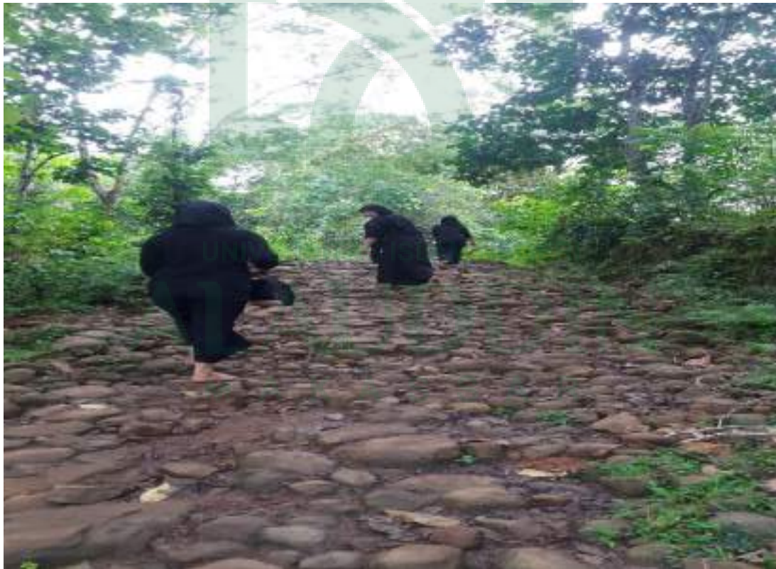
Jalan menuju rumah adat desa tana toa(Kajang dalam)