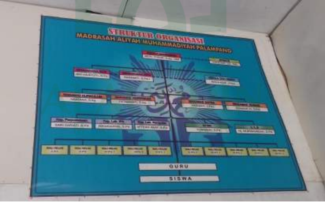
Foto Struktur Organisasi Sekolah Madrasah Aliyah Muhammadiyah Palampang.