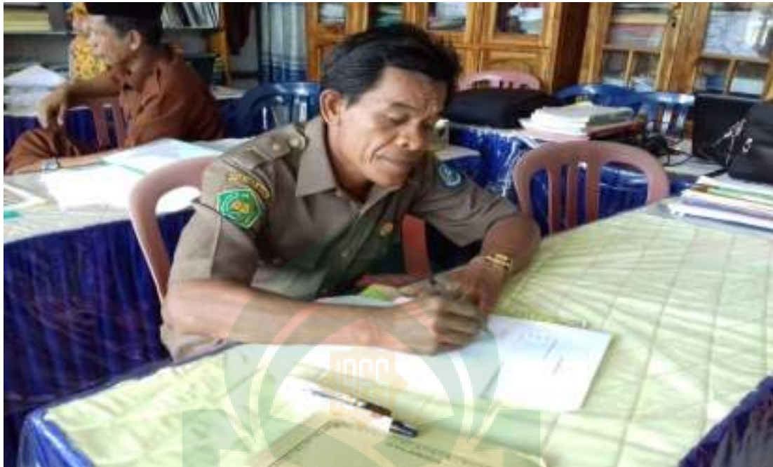
Foto pada saat memeriksa dan mengisi pedoman wawancara di sekolah Madrasah Aliyah Muhammadiyah Palampang.