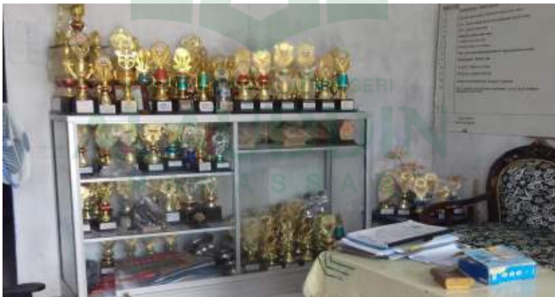
Foto piala berprestasi yang diperoleh oleh sekolah Madrasah Aliyah Muhammadiyah Palampang.