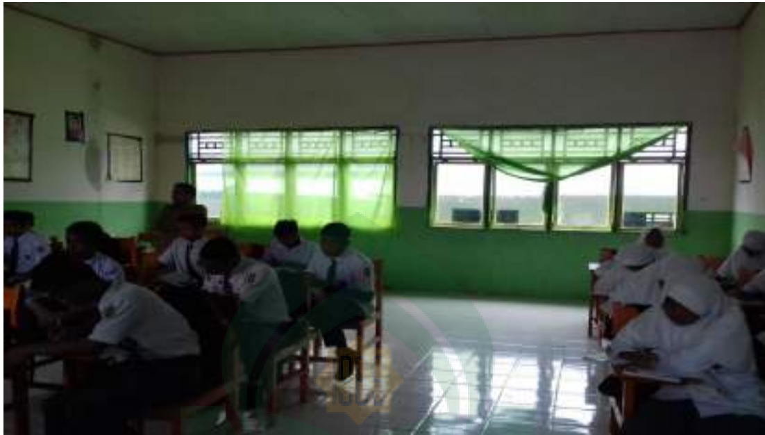
Foto pada saat pelajaran sedang berlangsung di sekolah Madrasah Aliyah Muhammadiyah Palampang.