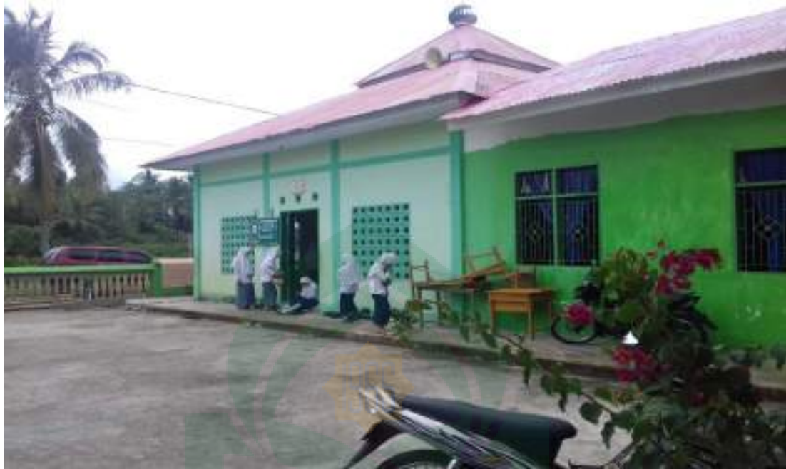
Foto keadaan Masjid Sekolah Madrasah Aliyah Muhammadiyah Palampang pada saat waktu sholat Dzuhur.

UNIVERSITAS ISLAM NEGERI ALAUDDIN M A K A S S A R