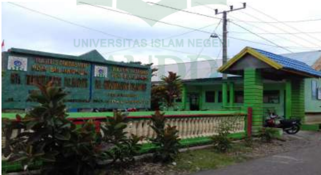
Foto halaman bagian depan sekolah Madrasah Aliyah Muhammadiyah Palampang Bulukumba.