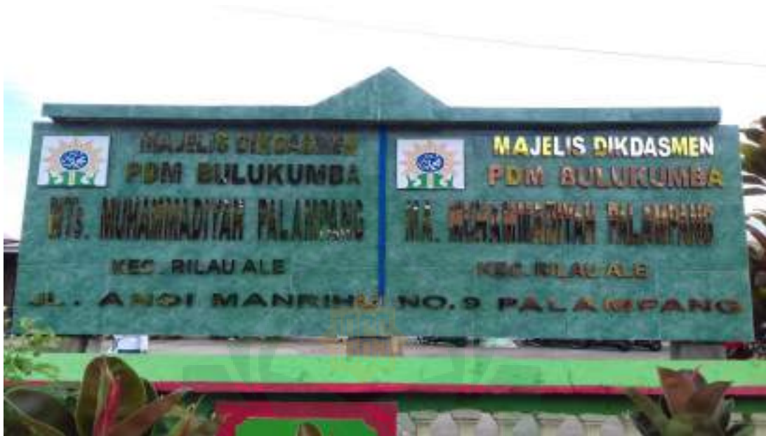
Foto Papan Nama Sekolah Madrasah Aliyah Muhammadiyah Palampang.