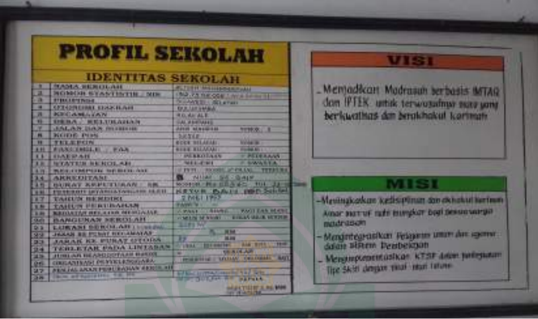
Foto Profil Sekolah dan Visi-Misi Sekolah Madrasah Aliyah Muhammadiyah Palampang.