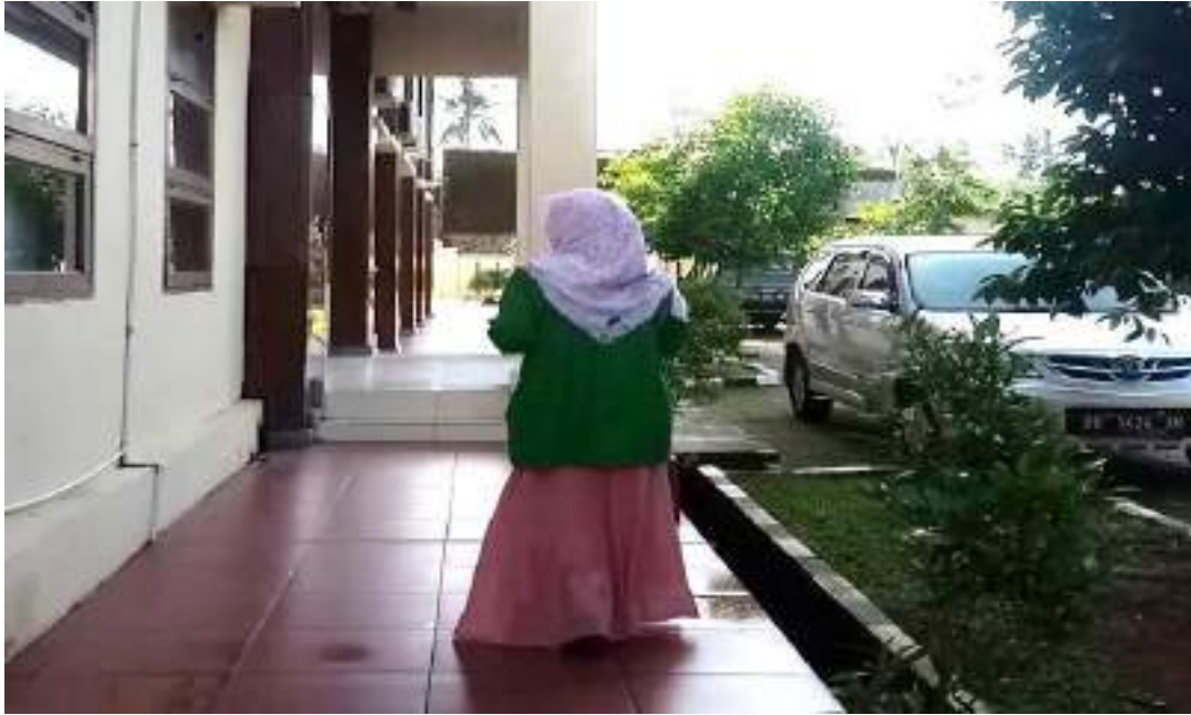
Menuju lokasi penelitian