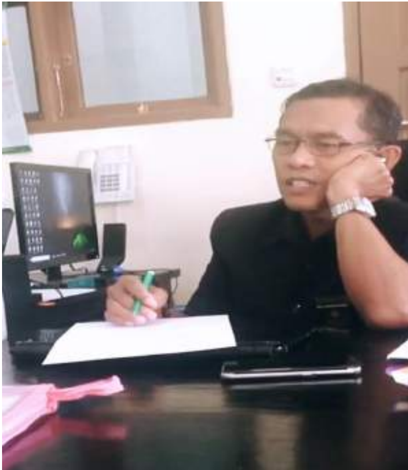
Salah satu narasumber yang di wawancarai