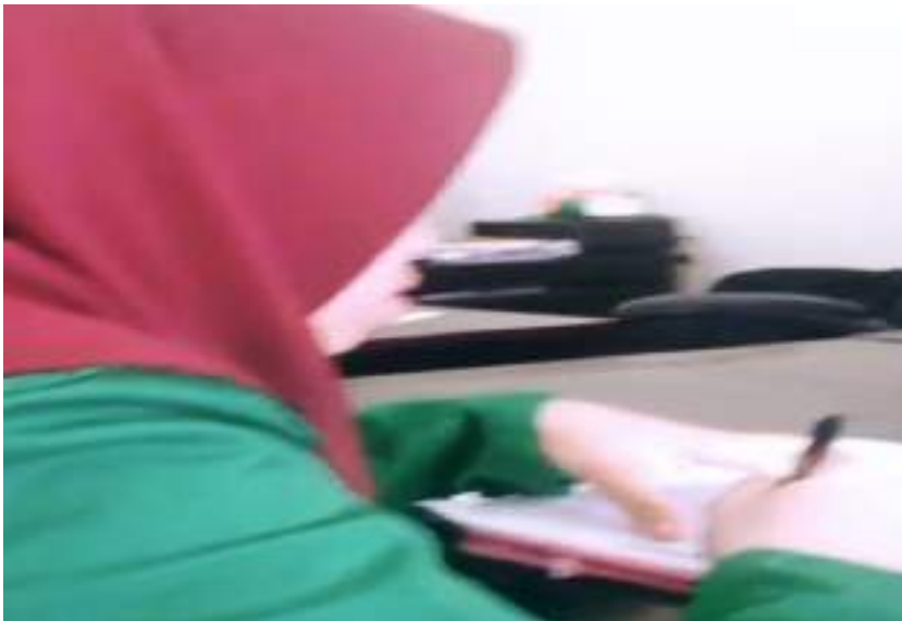
Proses Tanya jawab kepada narasumber