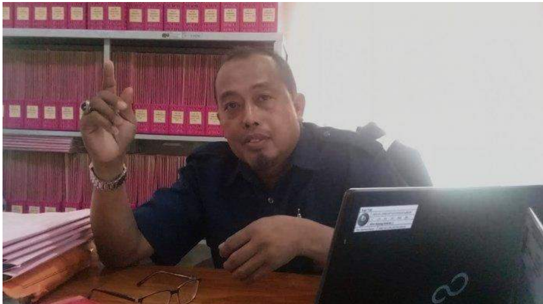
Bapak panitera muda Pengadilan Agama Makassar saat pengambilan berkas untuk wawancara