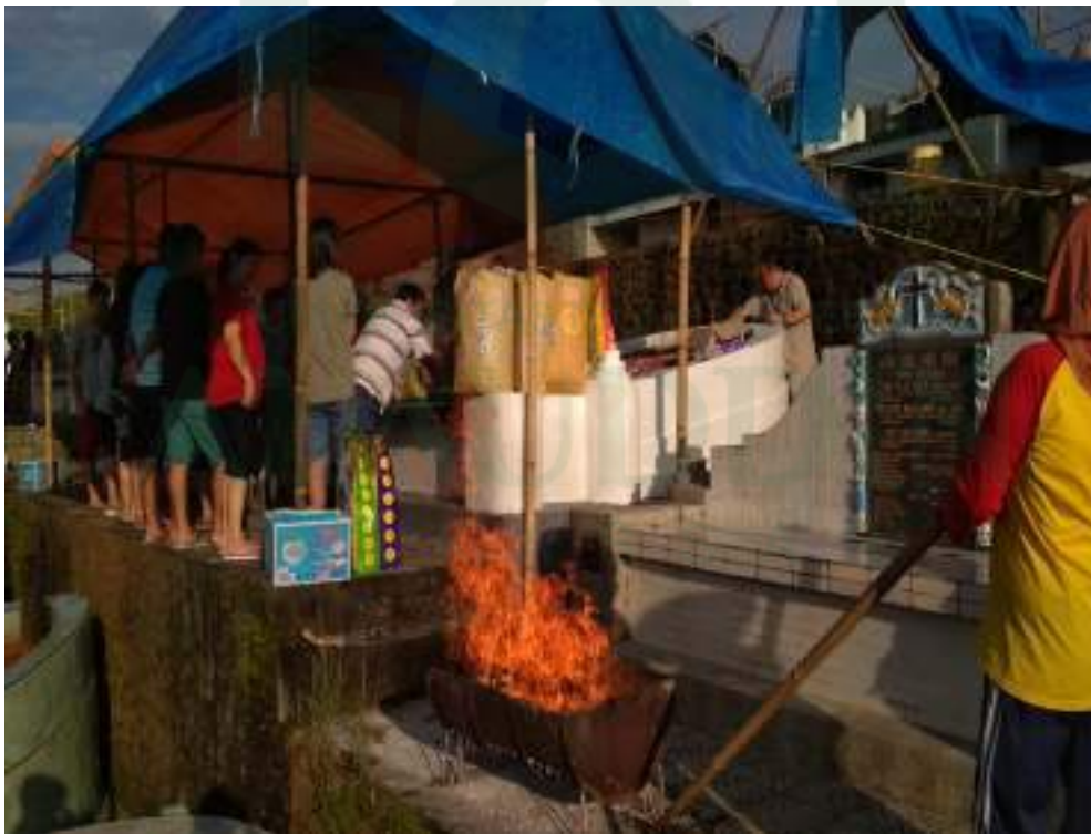
Foto pembakaran kertas