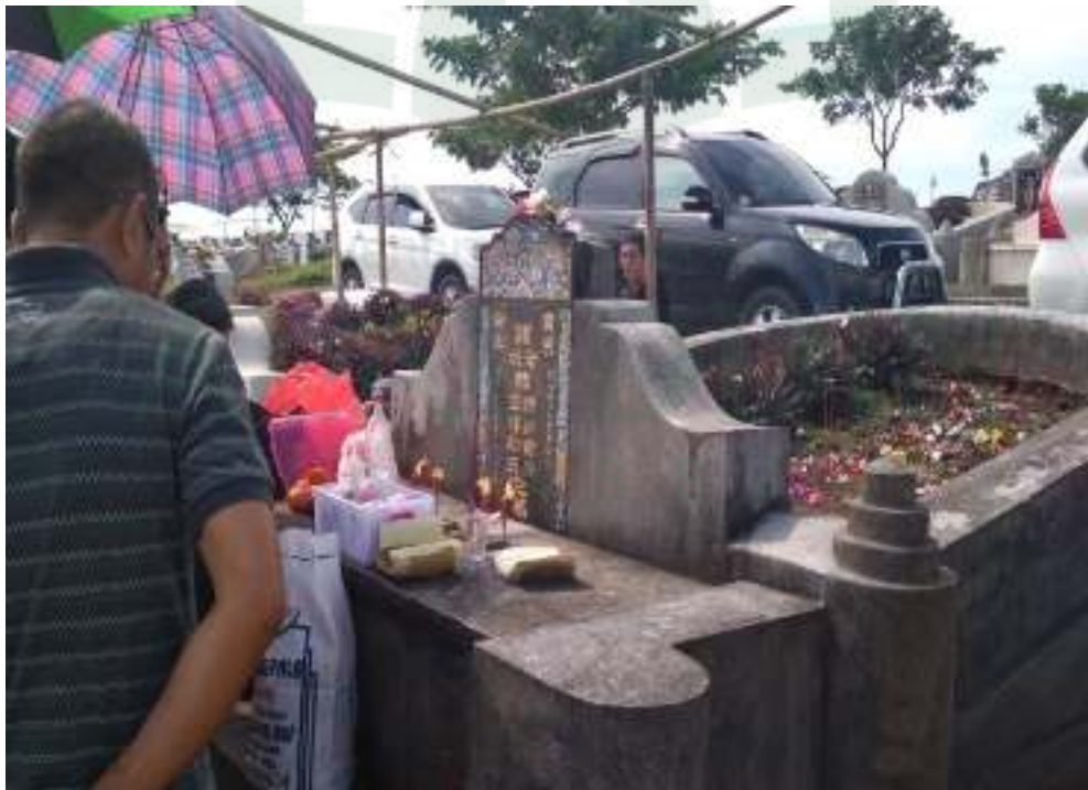
Suasana berlangsungnya ziarah kubur.