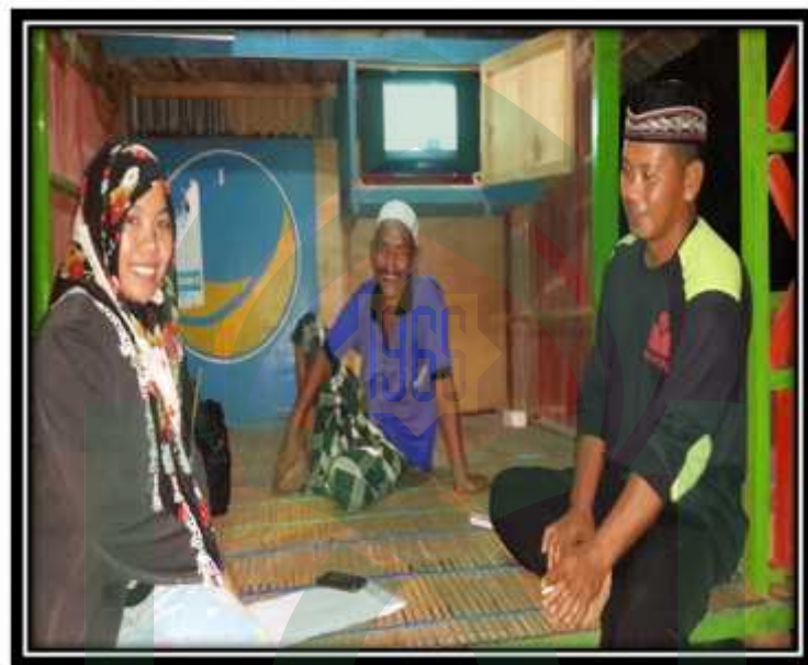
Gambar . 6: Hasil Wawancara yang memiliki alat teknologi modern 8 juni 2016 (di pinggir jalan).