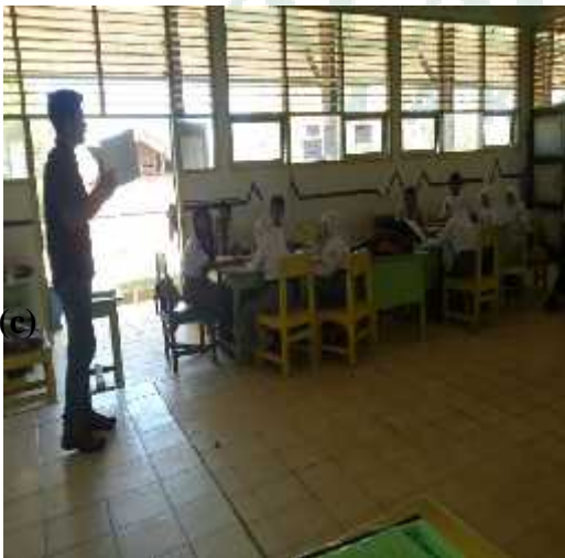
( c )