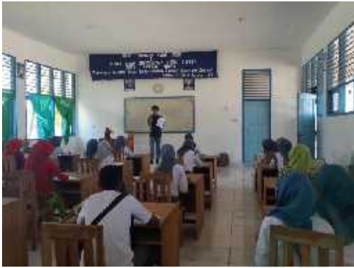
( a )