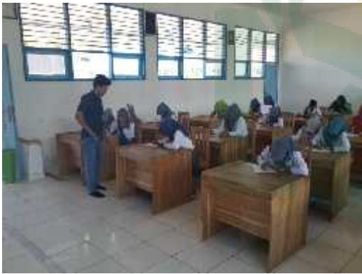
( b )