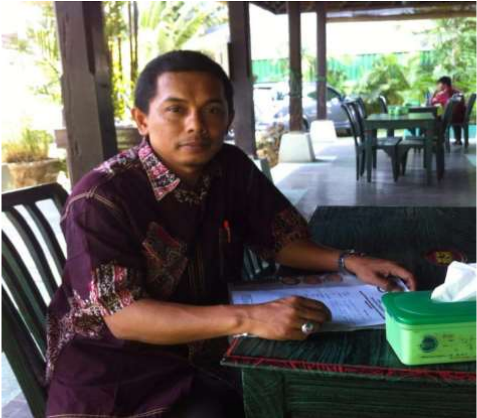
Photo ini yang sy mau pasang di CV