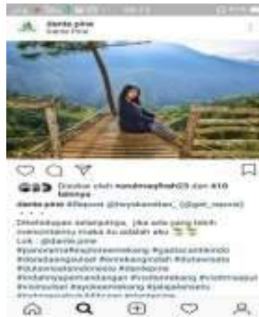
Gambar 6. Contoh Repost pada Akun Instagram @dantepine ( 5 November 2018)

menggunakan #wisatadantepine berarti hal tersebut menunjukkan bahwa pengguna Instagram lain tersebut sudah pernah kesana.