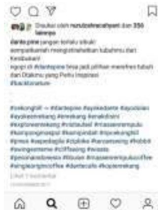
Gambar 5. Contoh Hashtag (#) pada Akun Instagram @dantepine ( 5 November 2018)

#explorenre kang #hashtageksploreenre kang #lingkarmaspul #ayokeenre kang #sulawesiholiday dan sebagainya juga sering dicantumkan pada setiap mengunggah foto dalam @dantepine.