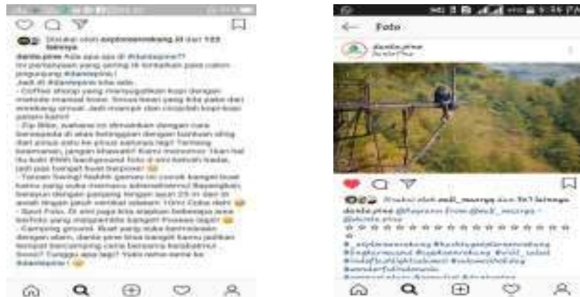
Gambar 8, yang menunjukkan feedback berupa Like dan komentar pada Instagram @dantepine ( 5 November 2018)

Hal tersebut didukung hasil wawancara dengan duta wisata enrekang 2017 Pratiwi Iskandar Tangko dengan akun Instagramnya @twyskandtan. Sebagai follower dalam akun Instagram @dantepine, saat diwawancarai menyatakan bahwa: