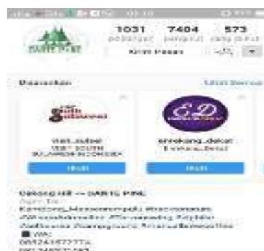
Gambar 2. Jumlah Follower akun instagram @dantepine ( 05 November 2018)

Pengelola akun Instagram @dantepine juga membuka peluang bagi para pengguna Instagram dan followernya untuk berkomentar terhadap hal yang mereka bagikan di Instagram, sehingga proses komunikasi menjadi timbal balik, bukan hanya satu arah. Proses interaksi inilah yang sangat penting dalam penggunaan Instagram. Saat ini jumlah follower pada akun Instagram @dantepine sejak dibuat pada agustus 2018 sampai sekarang ini sekitar 7404 follower .