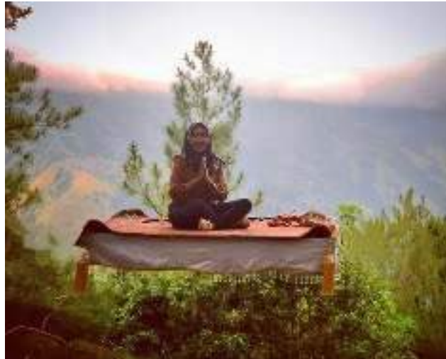
( Karpét Aladin)