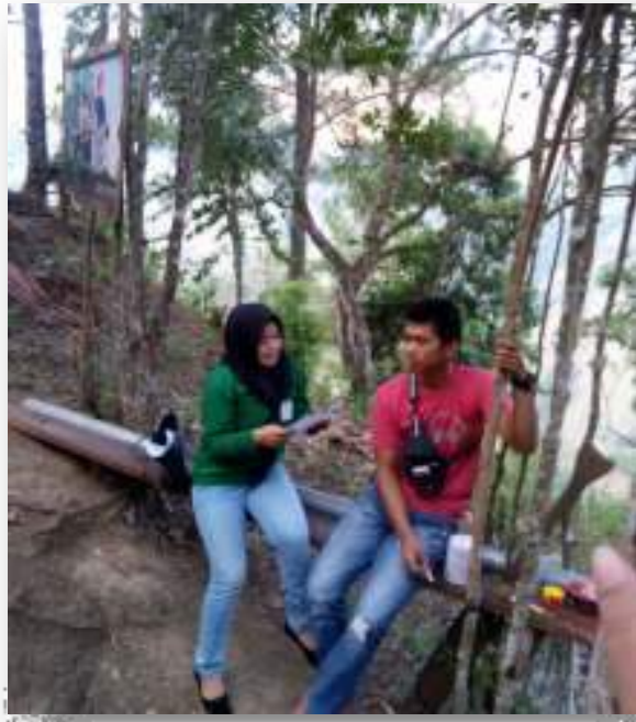
Wawancara dengan Bair ( Biro logistik)