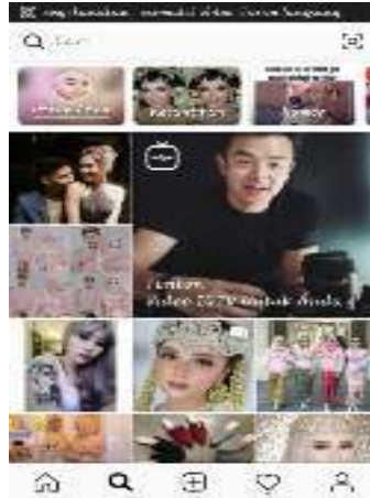
Gambar 7. menunjukkan fitur searchstagram pada media Instagram

melalui foto-foto yang dikirim untuk diposting di @dantepine, dan kita juga bantu promosikan akun mereka supaya followernya bertambah.” 72