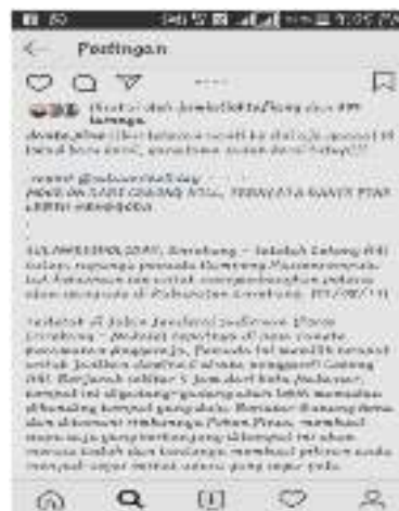
Gambar 4. Caption pada Akun Instagram @dantepine ( 5 November 2018)

Dari observasi yang dilakukan peneliti menunjukkan adanya caption yang menginformasikan keterangan lokasi lengkap foto, seperti salah satu contohnya yaitu: