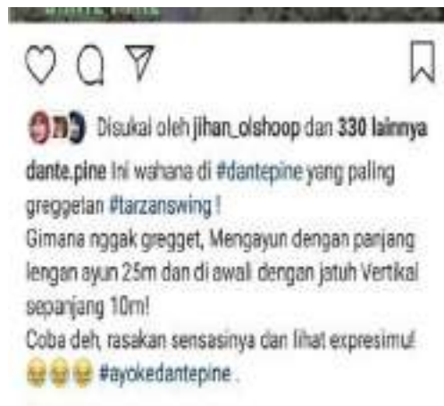
Gambar 3. Caption pada Akun Instagram @dantepine ( 5 November 2018)

Sebagian besar dalam mengunggah foto, pengelola wisata Dante Pine juga menyertakan caption pada setiap foto-foto unggahannya. Dalam mempromosikan potensi wisata, Hardiono menyatakan bahwa bukan hanya foto saja yang digunakan untuk menarik perhatian pengguna Instagram lain, melainkan juga didalam foto tersebut juga ada ajakan untuk ke tempat wisata serta ajakan agar pengguna lain mau bergabung dan ikut berpartisipasi langsung ke tempat wisata. Salah satu caption nya yaitu: