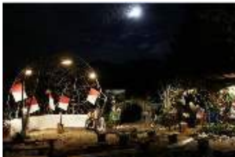
( Cafe Dante Pine)