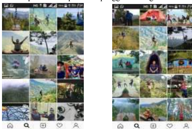
Gambar 1. Unggahan Foto Objek Wisata pada akun instagram @dantepine (22 November 2017)

Jadi dari wawancara dengan salah satu pengelola di atas menyebutkan bahwa dengan foto keadaan ditempat wisata dapat memunculkan pesan tersendiri untuk dapat menarik perhatian pengguna Instagram lain.