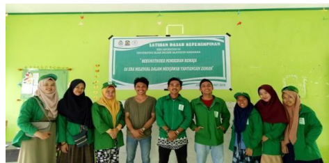
Latihan dasar kepemimpinan