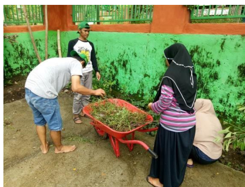
Kerja bakti di kantor desa