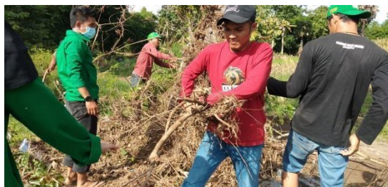
Kerja bakti di pemakaman