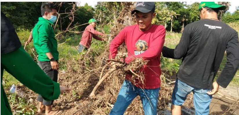
Kerja bakti di pemakaman