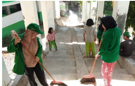
Kerja bakti di masjid