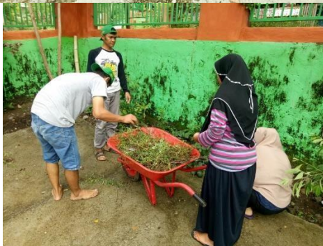
Kerja bakti di kantor desa