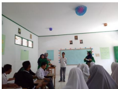
Mengajar di sekolah