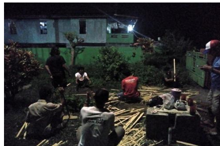
Pembuatan tempat sampah