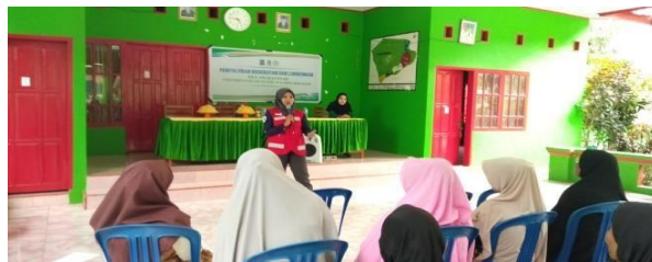
Penyuluhan kesehatan dan lingkungan