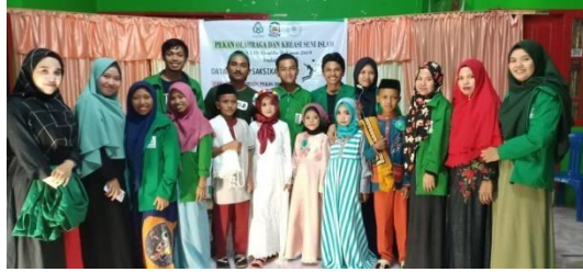
Kreasi seni islam