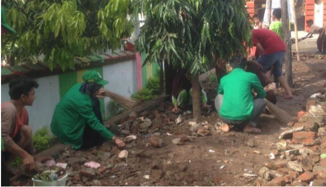
Kerja bakti di sekolah