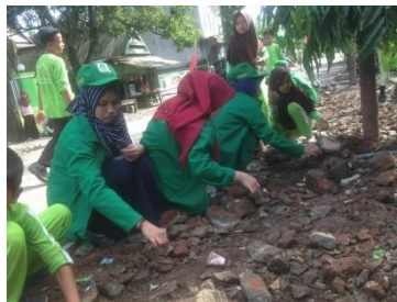
Kerja bakti di Sekolah SD