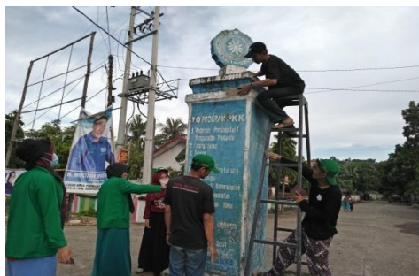
Pengecatan tugu dan batas dusun