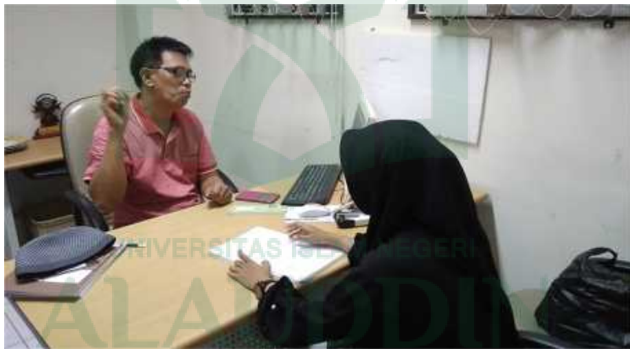
FOTO WAWANCARA DOSEN/KETUA JURUSAN KESEJAHTERAAN SOSIAL FAKULTAS DAKWAH DAN KOMUNIKASI ISLAM