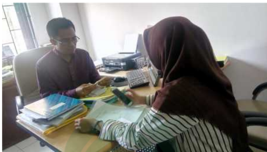
FOTO BERSAMA DOSEN/KETUA JURUSAN SEJARAH KEBUDAYAAN ISLAM FAKULTAS ADAB DAN HUMANIORA