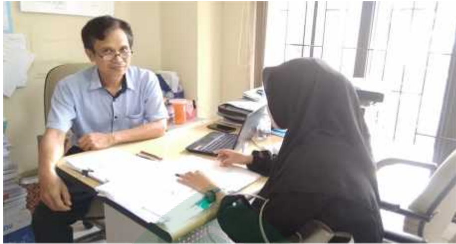
FOTO WAWANCARA DENGAN DOSEN/KETUA JURUSAN ILMU KEPERAWATAN FAKULTAS KEDOKTERAN DAN ILMU KESEHATAN