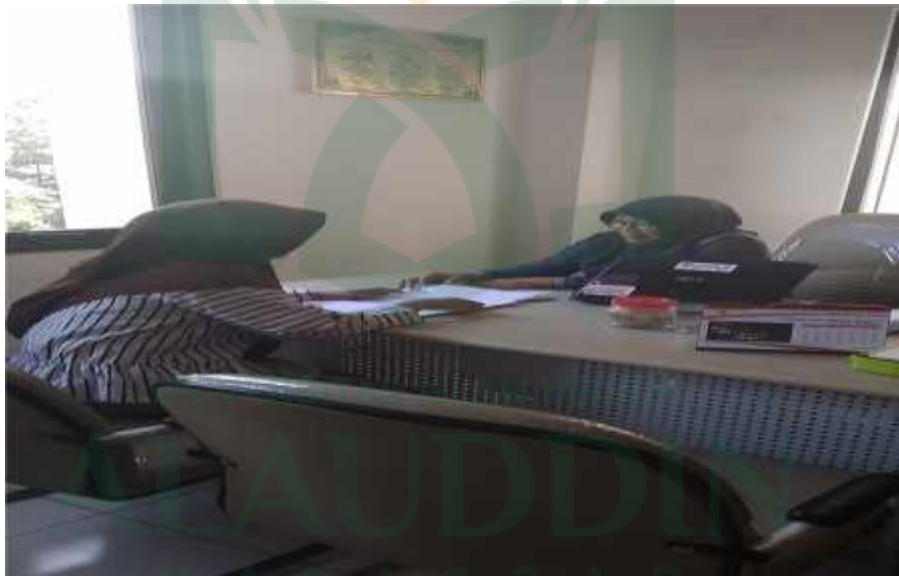
FOTO WAWANCARA DENGAN DOSEN FAKULTAS USHULUDDIN, FILSAFAT DAN ILMU POLITIK