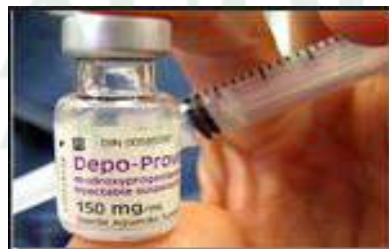
Gambar 2.1: Obat Suntik (Sumber:

Contoh obat suntik yang mengandung 150 mg Depo Medroksiprogesteron Asetat bisa dilihat pada gambar berikut: