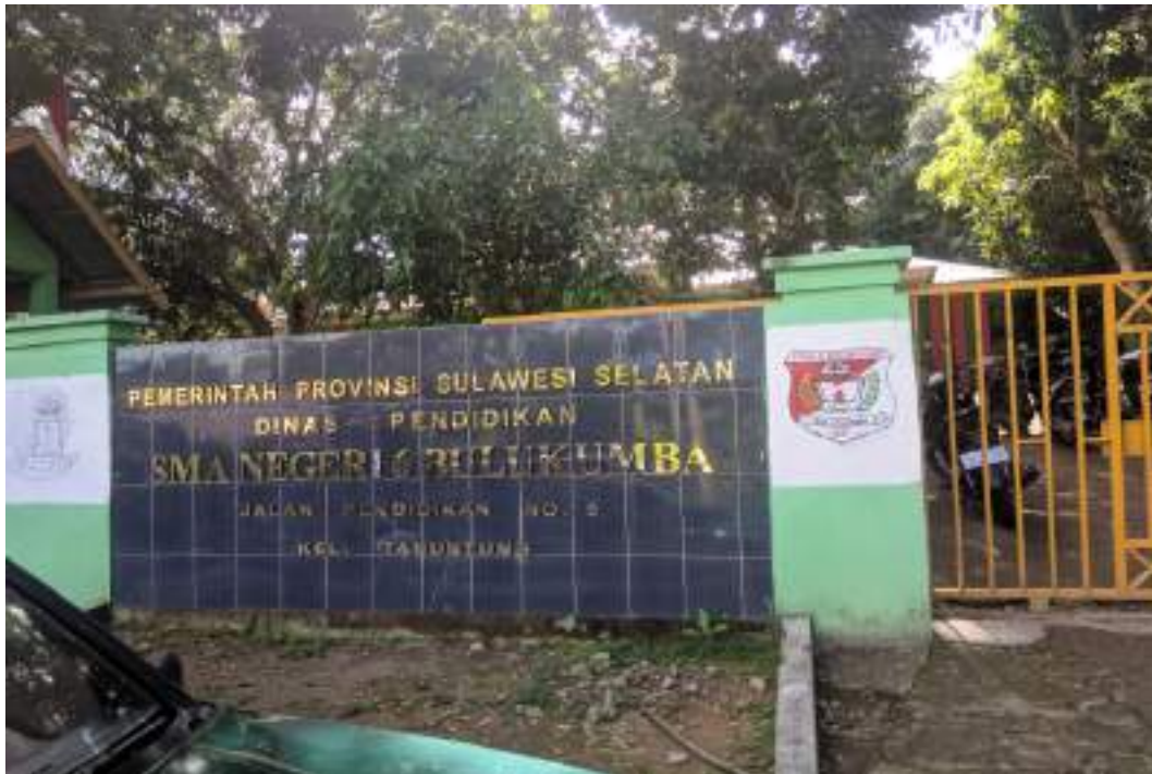
Gambar 1 Tampak Depan SMA Negeri 6 Bulukumba. (18 Februari 2019)