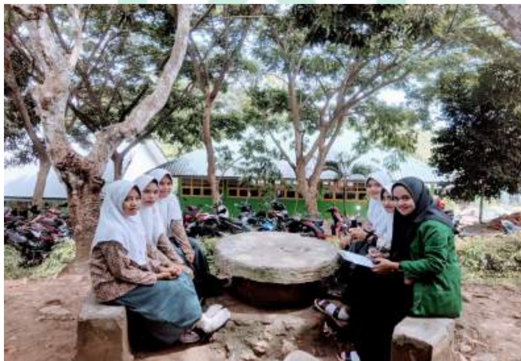
Gambar 20. Foto Bersama dengan Siswa Kelas XII IPS 1. (04 Maret 2019)