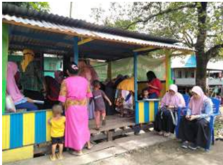
Keterangan: Kegiatan sosialisasi peningkatan kesehatan kepada masyarakat Desa Boribelayya