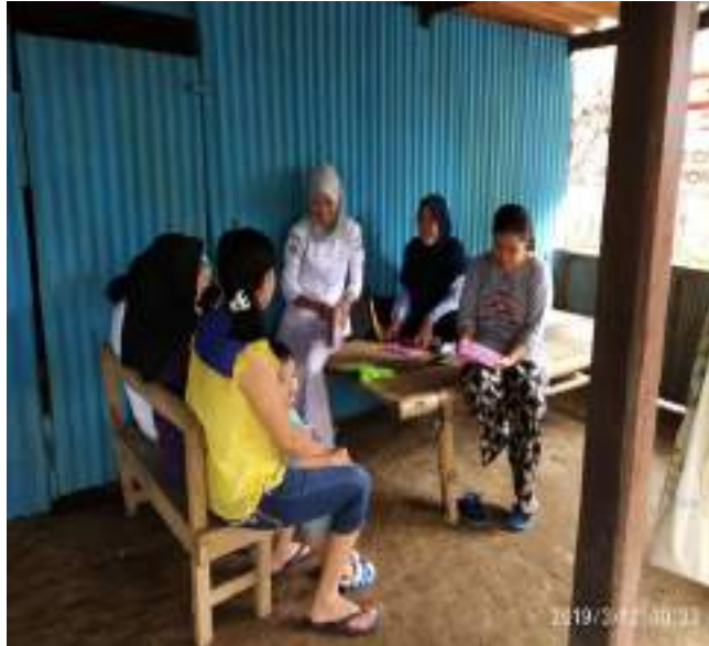
Keterangan: Salah satu Bidan Desa berbaur dengan masyarakat Desa Boribelayya