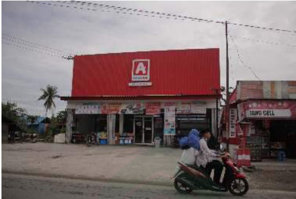
Ritel Pasar Modern di Jln Trans Sulawesi Kelurahan tomoni