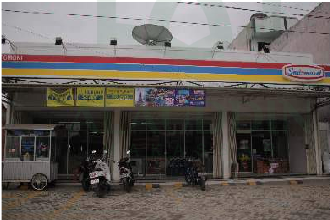
Ritel Pasar Modern Modern di Jln Trans Sulawesi Kelurahan tomoni