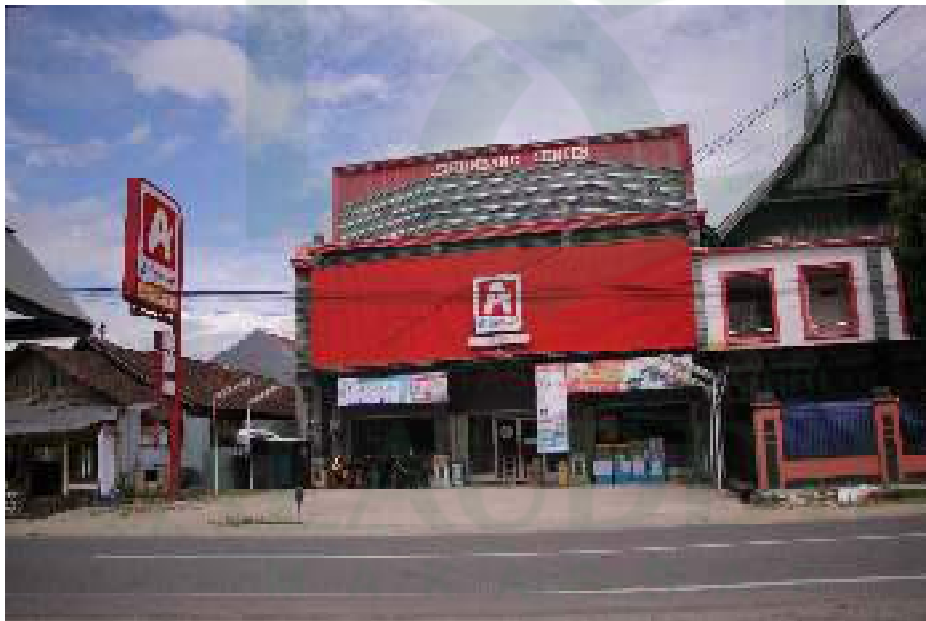
Ritel Pasar Modern di Jln Trans Sulawesi Kelurahan tomoni