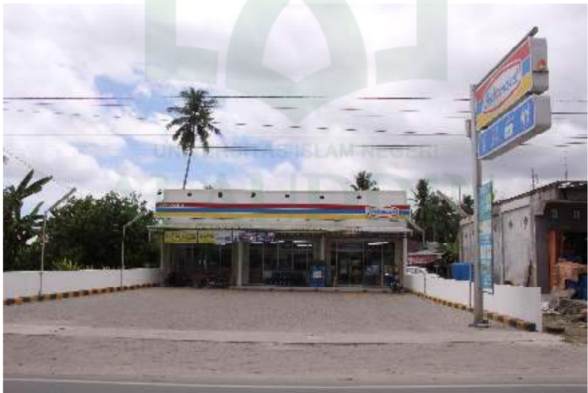
Ritel Pasar modern di Kelurahan Tomoni