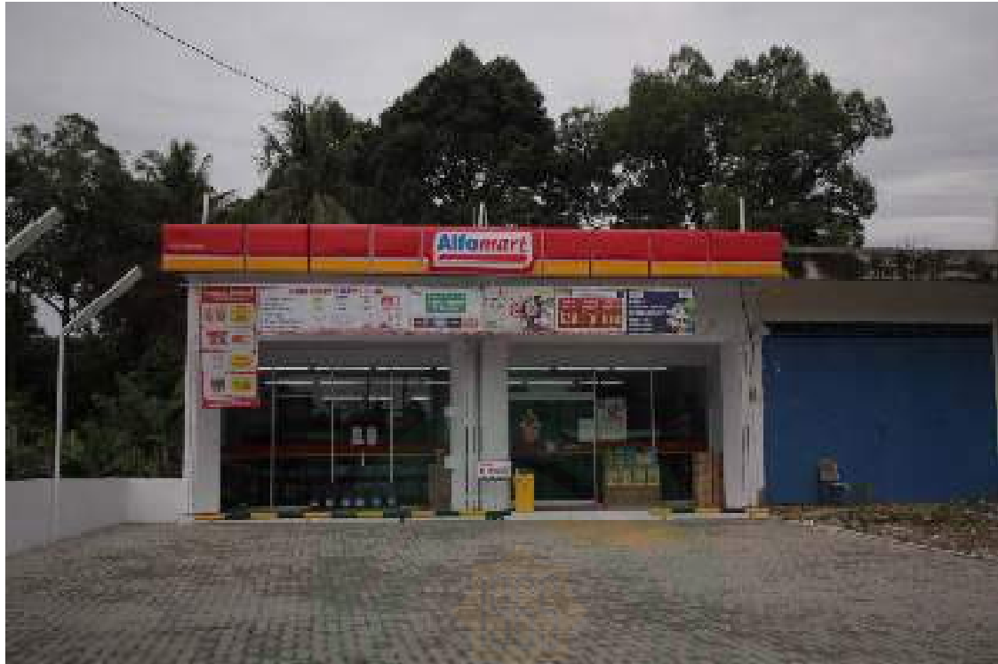
Ritel Pasar Modern Modern di Jln Trans Sulawesi Kelurahan tomoni