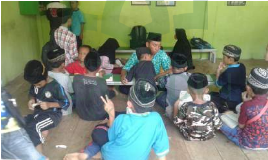
Keadaan santri saat mengaji