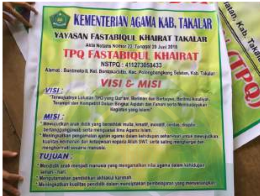
Visi, misi dan tujuan TPQ Fastabiqul Khairat