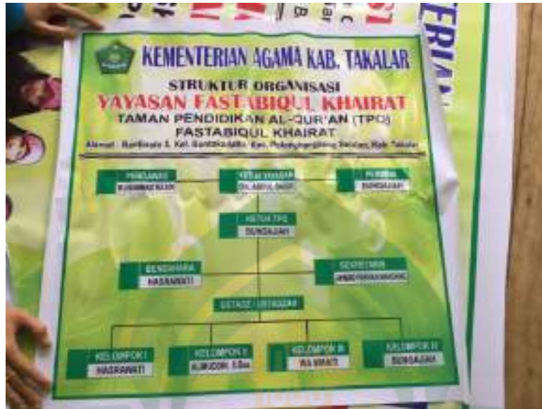
Struktur Organisasi TPQ Fastabiqul Khairat