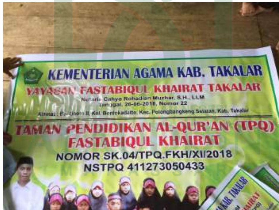
Spanduk papan nama TPQ Fastabiqul Khairat