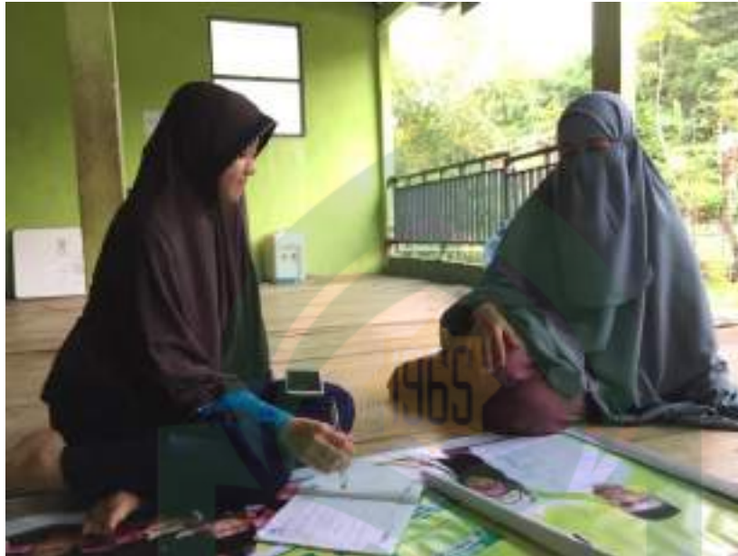
Wawancara dengan pendiri TPQ Fastabiqul Khairat