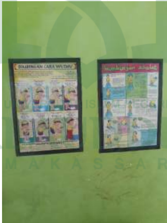
Poster bimbingan cara wudhu dan sholat