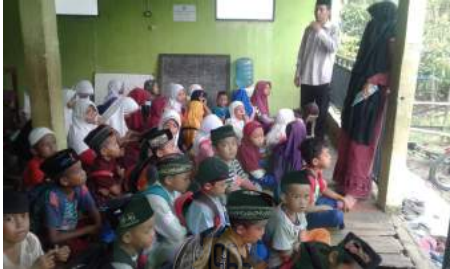
Keadaan santri setelah mengaji