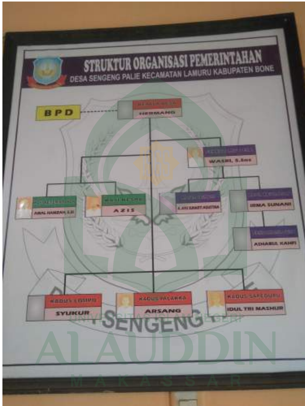
Gambar 2: Struktur Organisasi Desa Sengengpalie Kecamatan Lamuru Kabupaten Bone