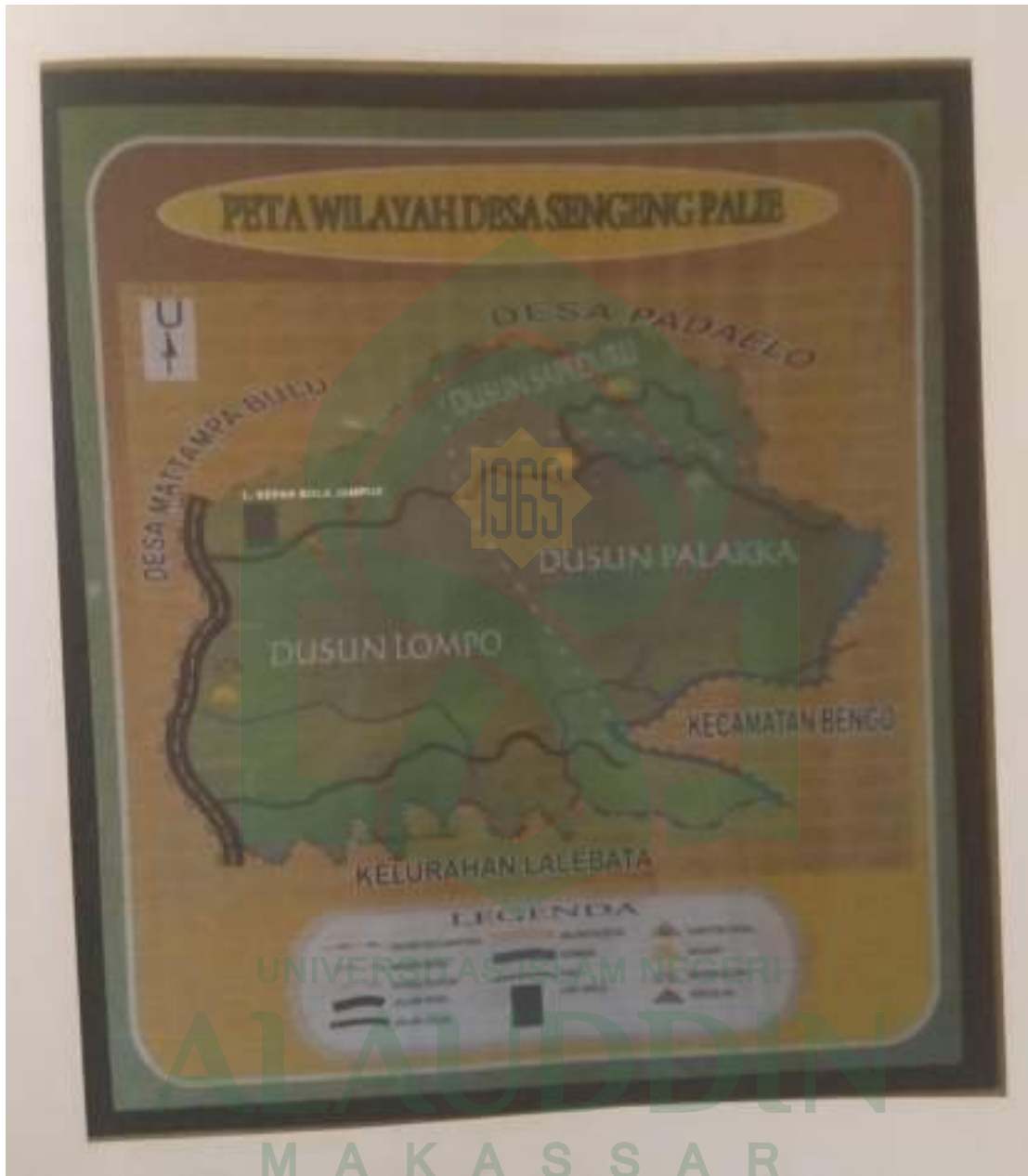
Gambar : Peta Wilayah Desa Sengengpalie, Kecamatan Lamuru Kabupaten Bone