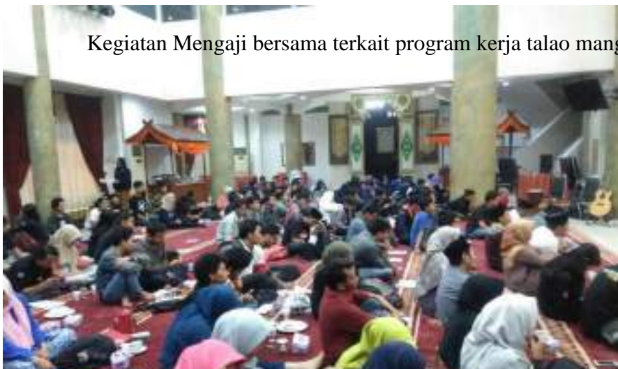
Kegiatan Mengaji bersama terkait program kerja talao mangaji

UNIVERSITAS ISLAM NEGERI ALAUDDIN MAKASSAR