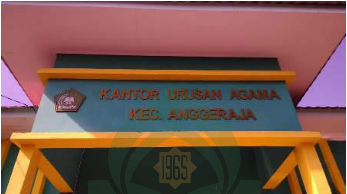
Kantor KUA Kelurahan Tanete Kecamatan Anggeraja Kabupaten Enrekang Tahun 2018