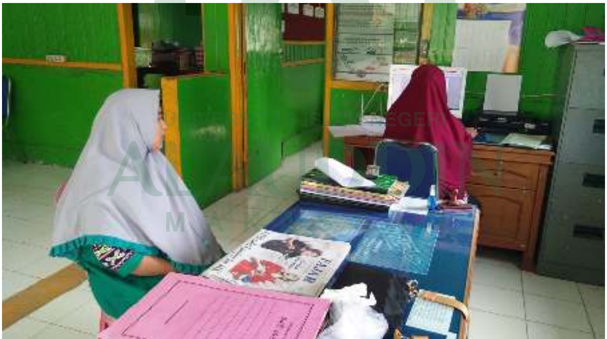
Kantor Lurah Keluhan Tanete Kecamatan Anggeraja Kabupaten Enrekang Tahun 2018