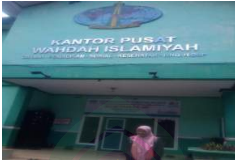
Kantor Pusat Wahdah Islamiyah Makassar