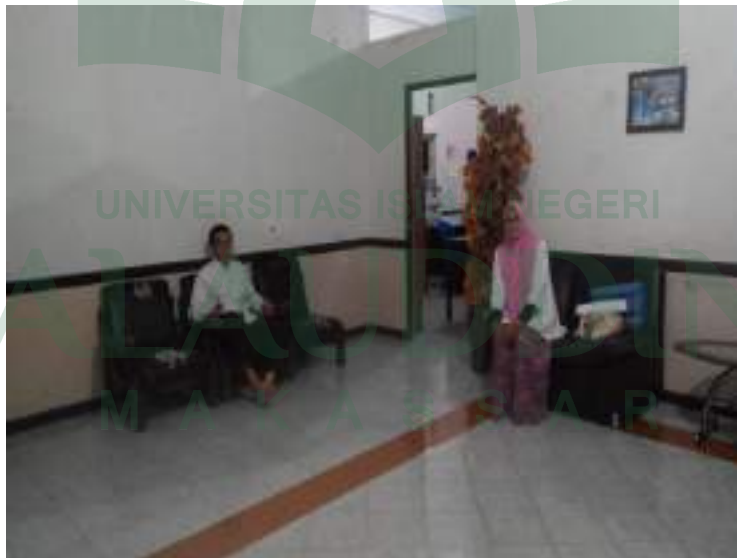
Wawancara dengan Pimpinan Wahdah Islamiyah Makassar