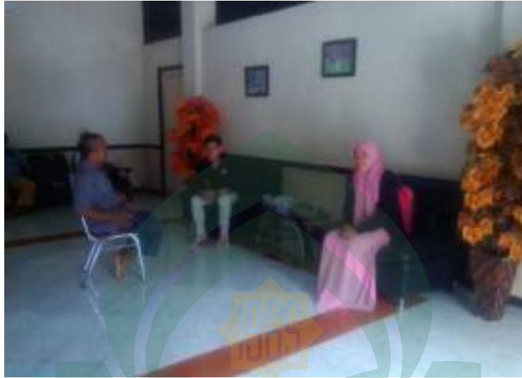
Wawancara dengan Staf Wahdah Islamiyah Makassar