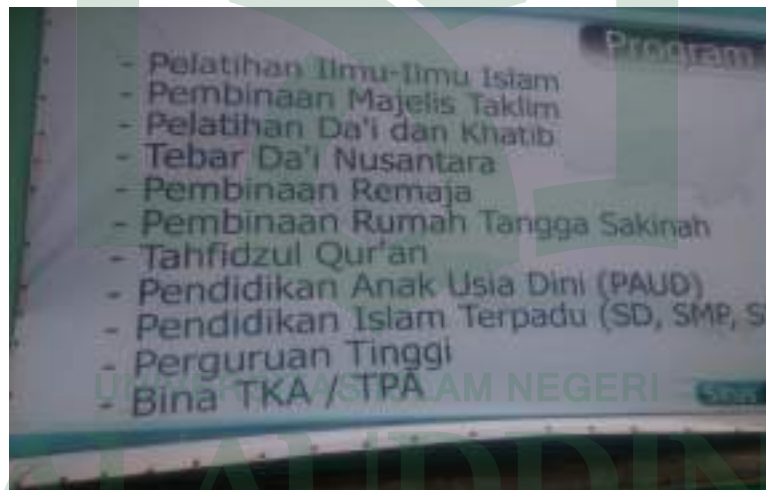
Program Kerja Wahdah Islamiyah Makassar