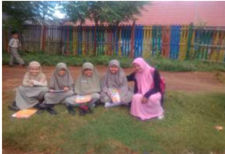
Foto Bersama Siswi SD Wahdah Islamiyah Makassar