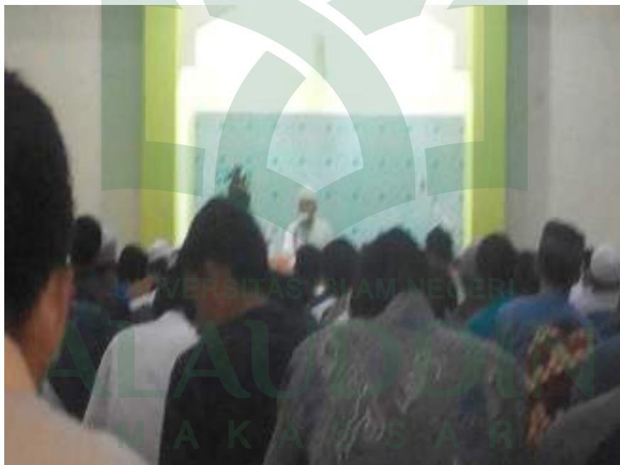
Pengajian Rutin Umum Kaum Laki-laki Wahdah Islamiyah Makassar