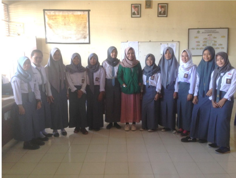
Foto Bersama Siswa SMA PGRI Sungguminasa Gowa