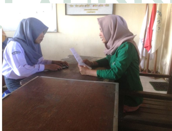
Wawancara Megawati Siswa Kelas XI IPA