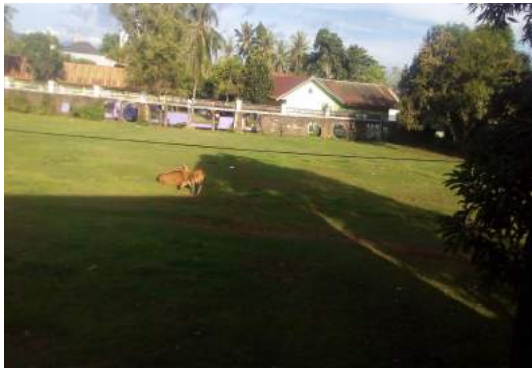
(Pagar Rumah Arajang Bissu dalam kondisi berlubang)