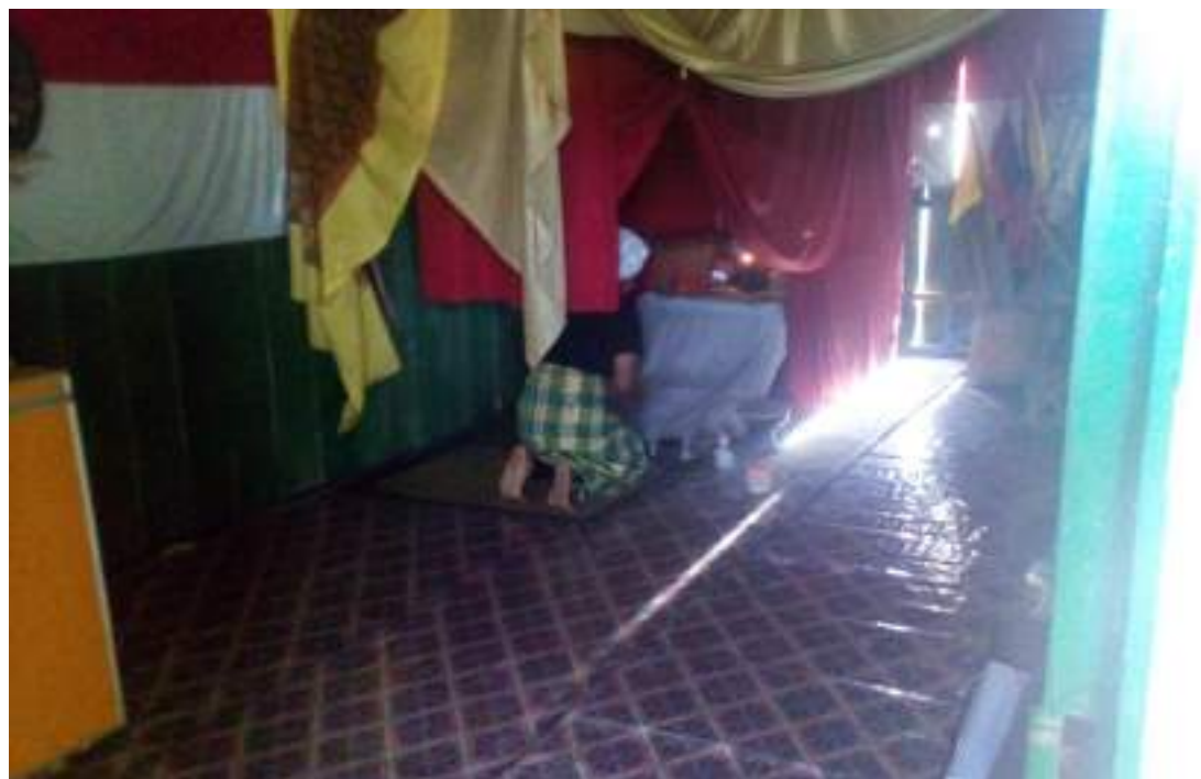
(Di dalam Arajang)