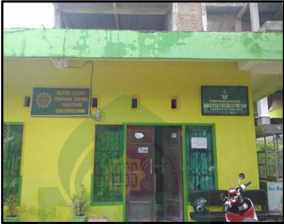
Sekretariat Pimpinan Daerah

UNIVERSITAS ISLAM NEGERI ALAUDDIN M A K A S S A R