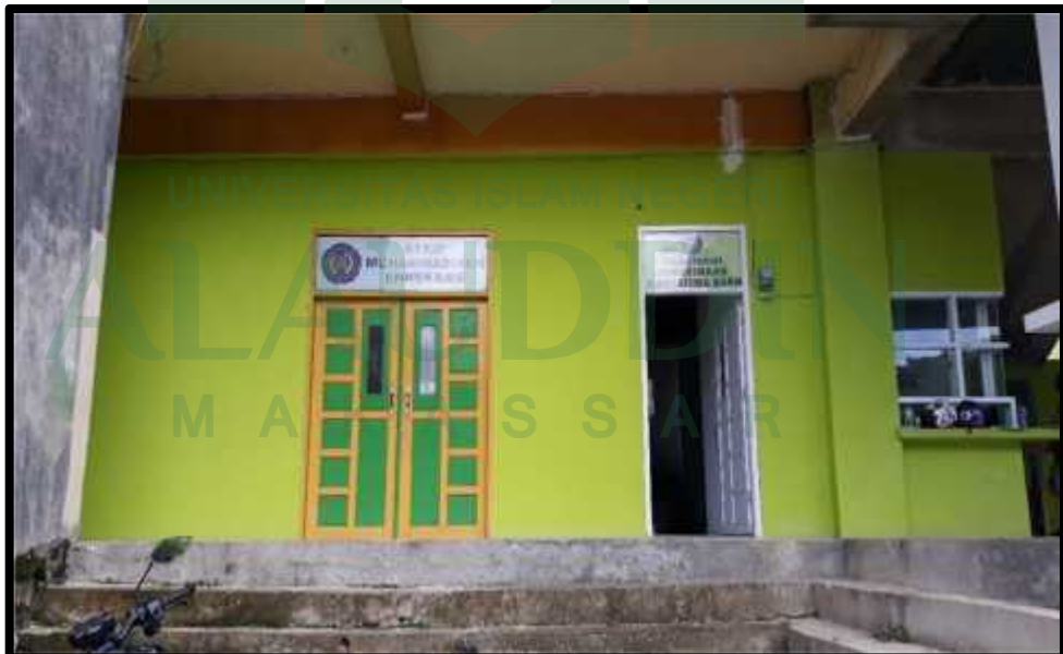
Amal Usaha dalam Bidang Sosial