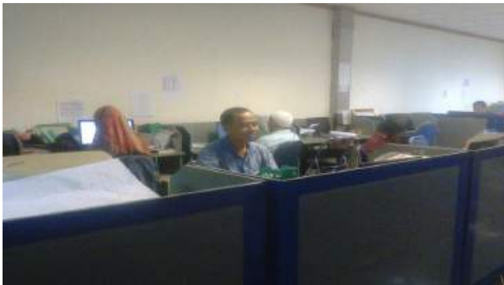
Suasana ruang redaksi Harian Ujungpandang Ekspres