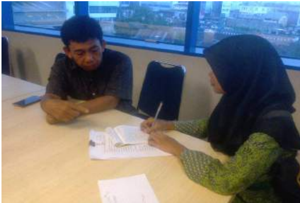
Wawancara bersama Manajer Personalian