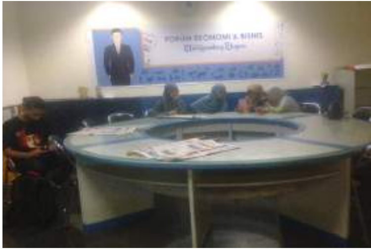
Ruang rapat redaksi Harian Ujungpandang Ekspres