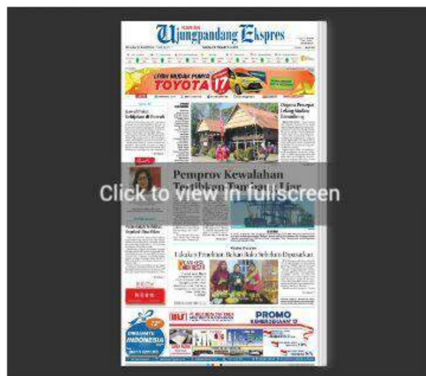
Tampilan E-paper lewat smartphone di laman Upeks.co.id