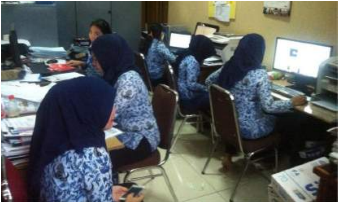
Mengamati Kegiatan staf humas pemerintah kota Makassar dalam melaksanakan tugasnya