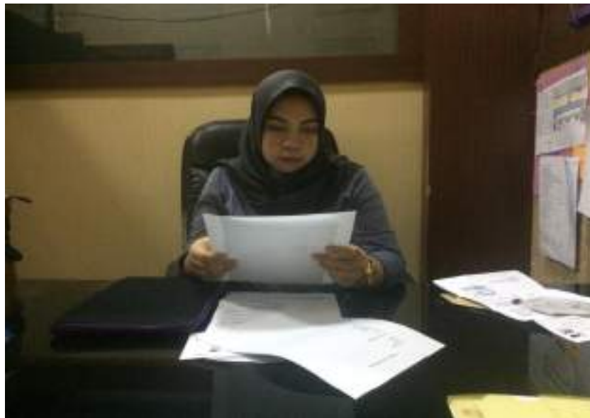
Wawancara dengan Kepala Bagian Sub Dokumentasi Humas Pemerintah Kota Makassar