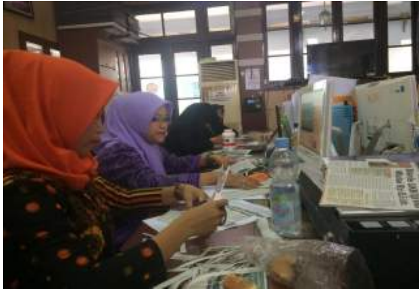
Wawancara dengan Staf Humas Pemerintah Kota Makassar