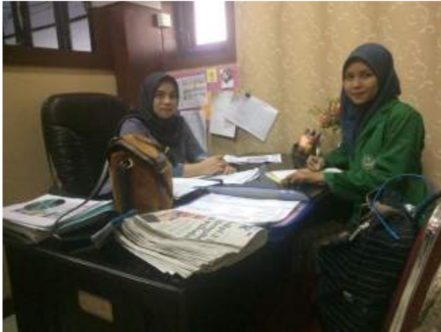
Wawancara dengan kepala sub bagian dokumentasi humas pemerintah kota Makassar