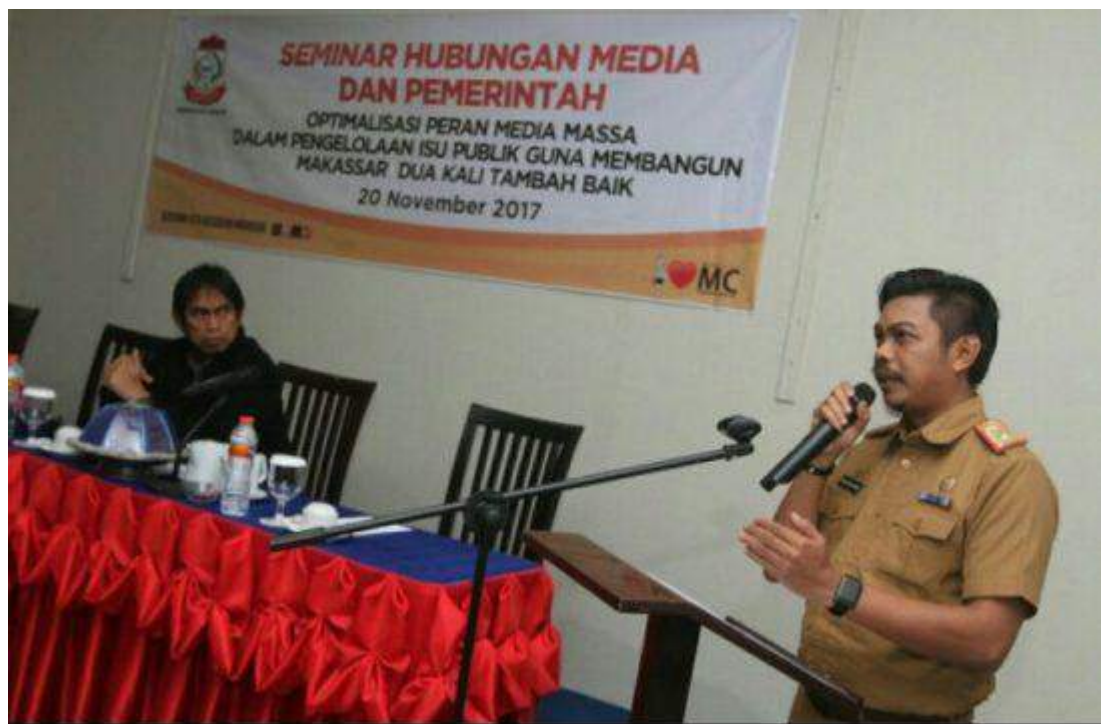
Mengamati kegiatan humas dalam menjalin kerjasama dengan media dalam seminar