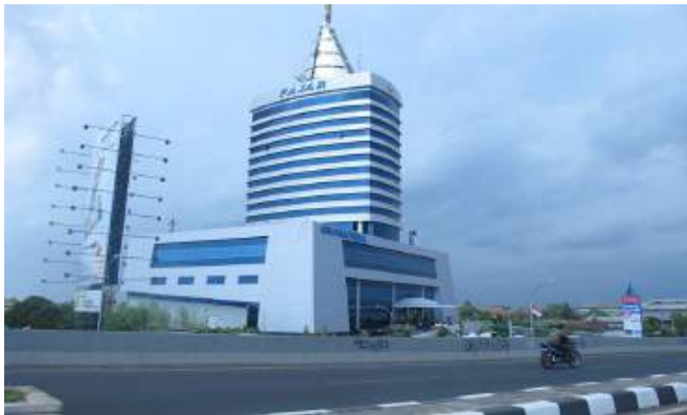
Gambar 4.1 Gedung Graha Pena

Tren bisnis yang semakin berkembang, anak perusahaan yang semakin menjamur, dan jumlah karyawan yang semakin banyak membuat keadaan kantor di Jalan Racing Centre dirasakan sudah tidak mampu lagi mengakomodasi semuanya. Rencana membangun kantor yang lebih besar pun dicetuskan. Mengadopsi model kantor milik Jawa Pos Group, Harian Fajar membangun gedung kantor Graha Pena di Jalan Urip Sumoharjo No. 20 Makassar. Diresmikan pada awal tahun 2007, gedung Graha Pena dengan 19 lantai menjadi gedung tertinggi pertama di luar pulau Jawa. 41