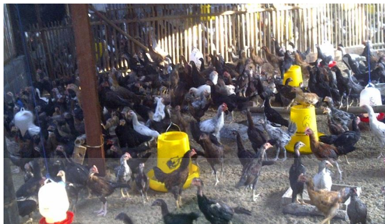
Gambar 1. Ayam Kampung Super

Hardjosubroto (1994), menyatakan bahwa ayam yang diternak masyarakat berasal dari 4 spesies Gallus , yaitu: