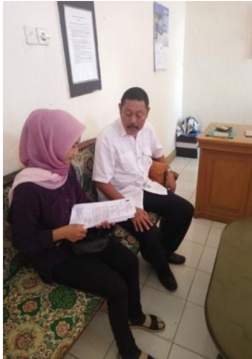
(Foto Wawancara Bersama Camat, Sekcam dan Kasi Pembangunan Kecamatan Mattirosompe Kabupaten Pinrang)