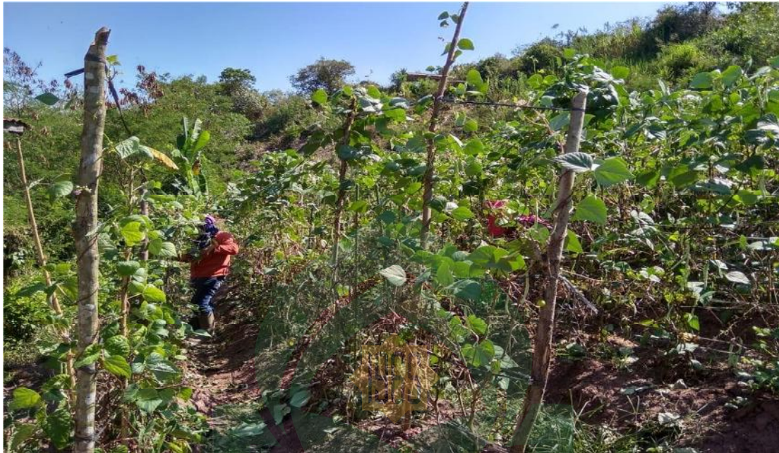
Masa Panen Tomat dengan Ketua Kelompok Wanita Tani Biring Salu