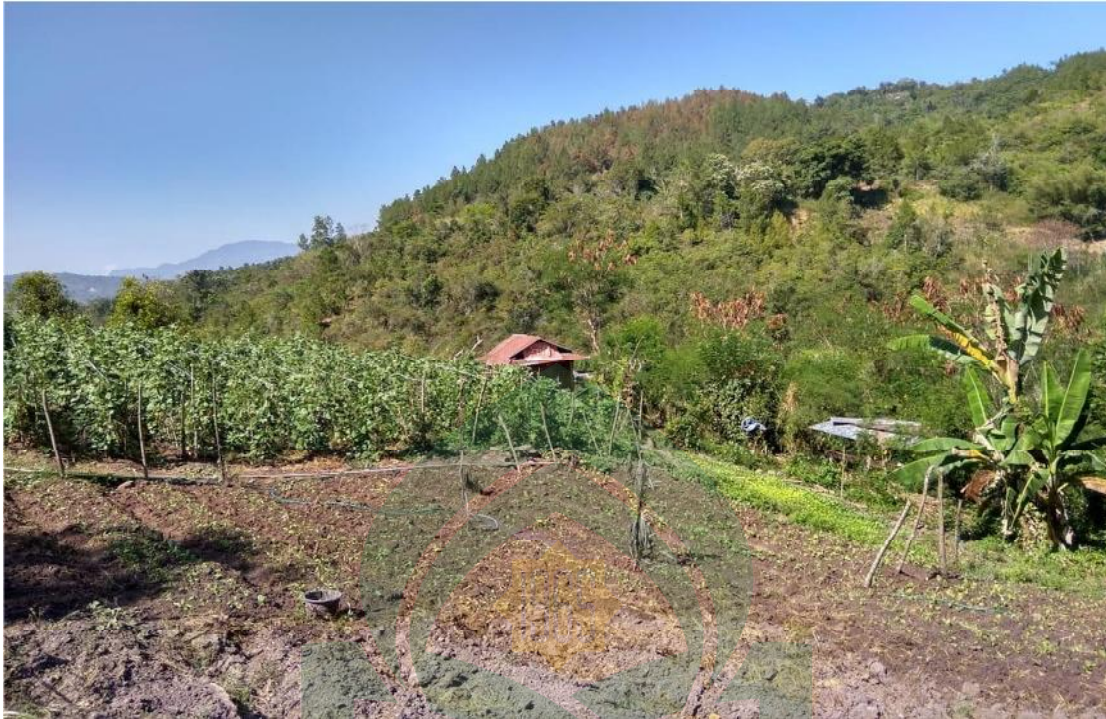
Panen Buncis dengan Bendahara Kelompok Wanita Tani Biring Salu