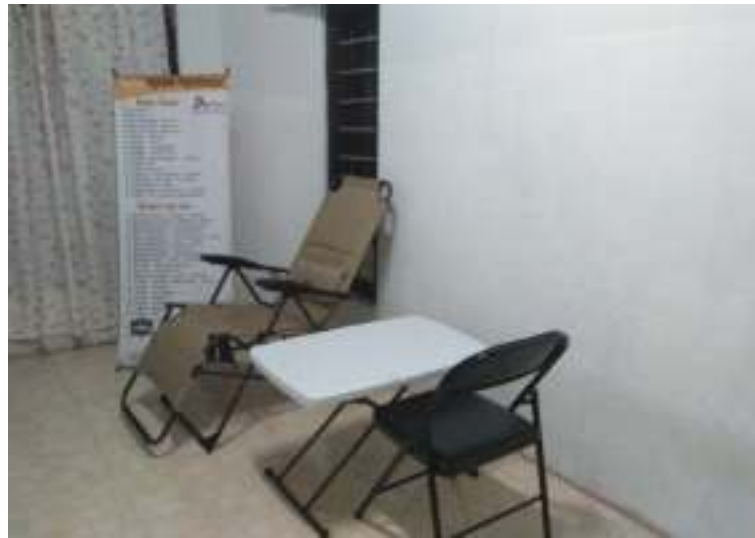
Klinik Hipnoterapi Anhar Foundation ( PERDOS UNHAS Antang, Jl. Komunikasi Timur Blok K No.25)