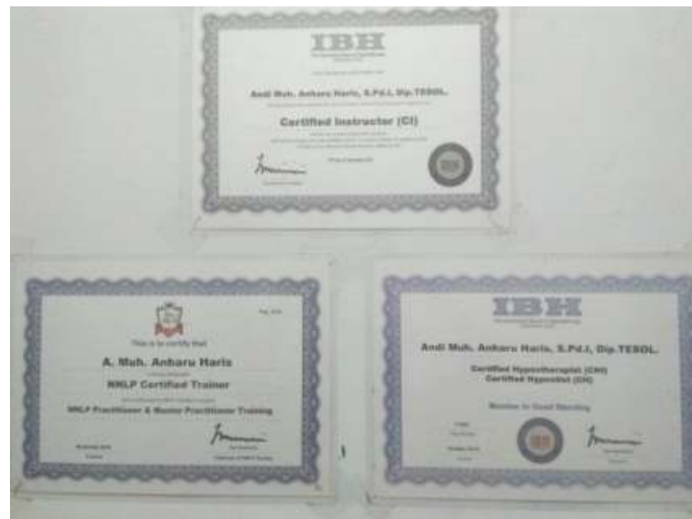
Sertifikat Terapis di Klinik Hipnoterapi Lembaga Anhar Foundation Kota Makassar