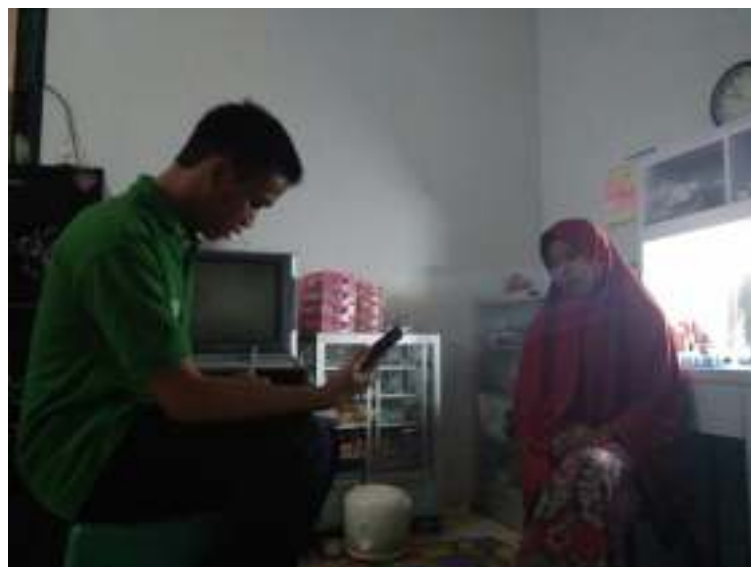
Wawancara dengan Klien Penderita Phobia Ular ( Ophidiophobia )