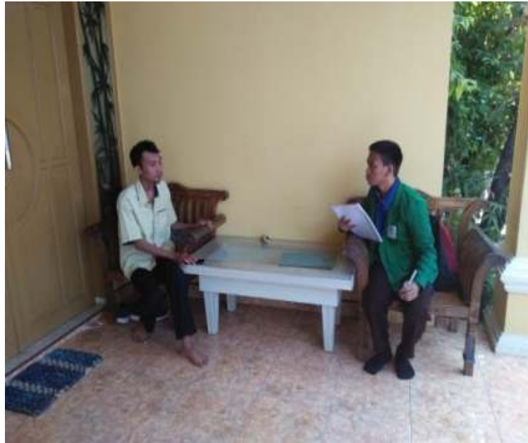
Wawancara dengan Klien Penderita Fobia Menikah ( Gemophobia )