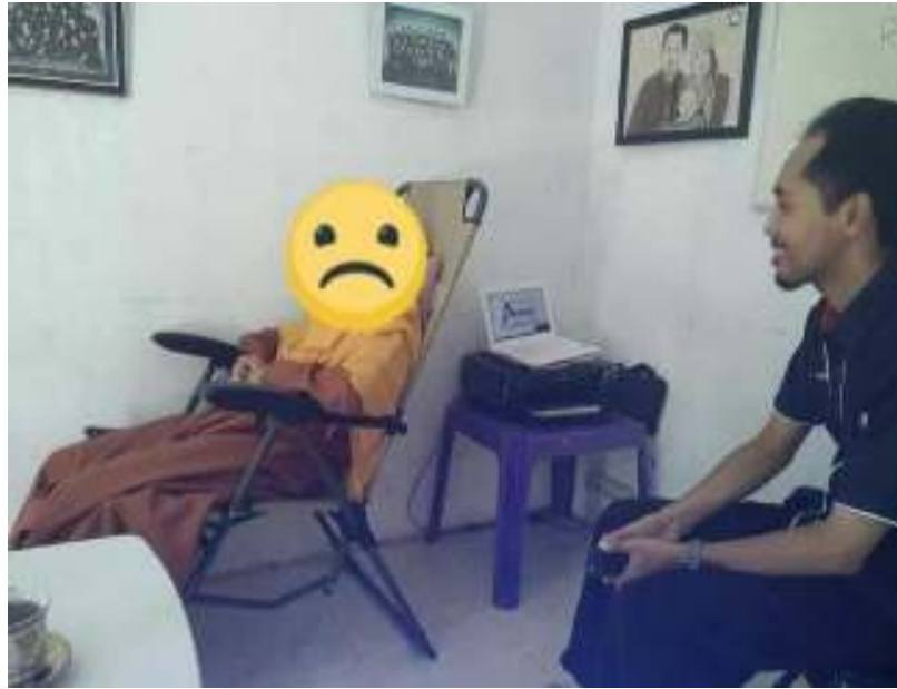
Dokumentasi Kegiatan Hipnoterapi di Kliik Hipnoterapi Lembaga Anhar Foundation Kota Makassar