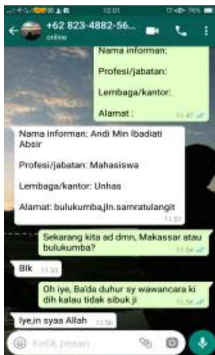
Percakapan pengantar untuk wawancara Melalui Telepon dengan Klien Penderita Tripophobia