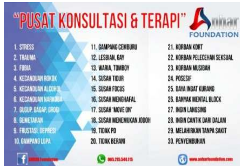
Layanan Terapi Klinik Hipnoterapi Lembaga Anhar Foundation Kota Makassar