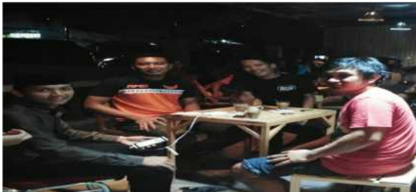
Gambar 4.3 Saat melakukan survei minat terhadap masyarakat

Dari hasil wawancara dengan Direktur Program Citra TV Bulukumba peneliti memperoleh gambaran bahwa melakukan survei minat terhadap kebutuhan masyarakat menjadi tantangan tersendiri bagi Citra TV Bulukumba dalam mengumpulkan segala pendapat yang disampaikan oleh masyarakat dan pihak Citra TV Bulukumba harus lebih mengembangkan program-programnya agar dapat diterima oleh pemirsa masyarakat Bulukumba.