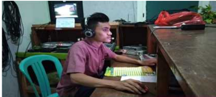
Gambar 4.2 Saat melakukan training atau uji coba siaran

telah dilakukan uji coba terlebih dahulu sebelum disiarkan kepada pemirsa masyarakat Bulukumba.