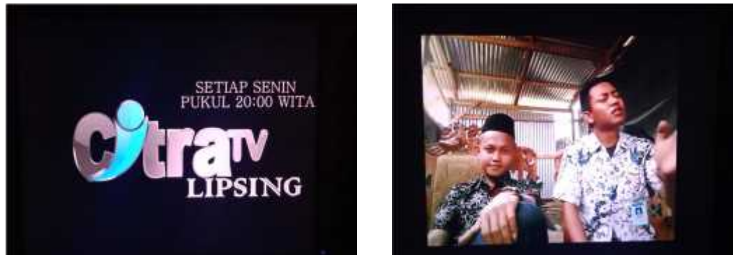
Gambar 4.1 Program Lypsing Citra TV Bulukumba

Strategi Citra TV Bulukumba dalam menjadikan program sebagai wahana hiburan bagi masyarakat tentu akan selalu ditingkatkan oleh pihak manajemen Citra TV agar tetap mempertahankan pelanggan yang sudah terikat dengan Citra TV Bulukumba. Pihak Citra TV Bulukumba selalu melakukan training terhadap segala program sebelum program tersebut disiarkan. Sebagaimana yang dikatakan Pimpinan Redaksi Citra TV Bulukumba: 10