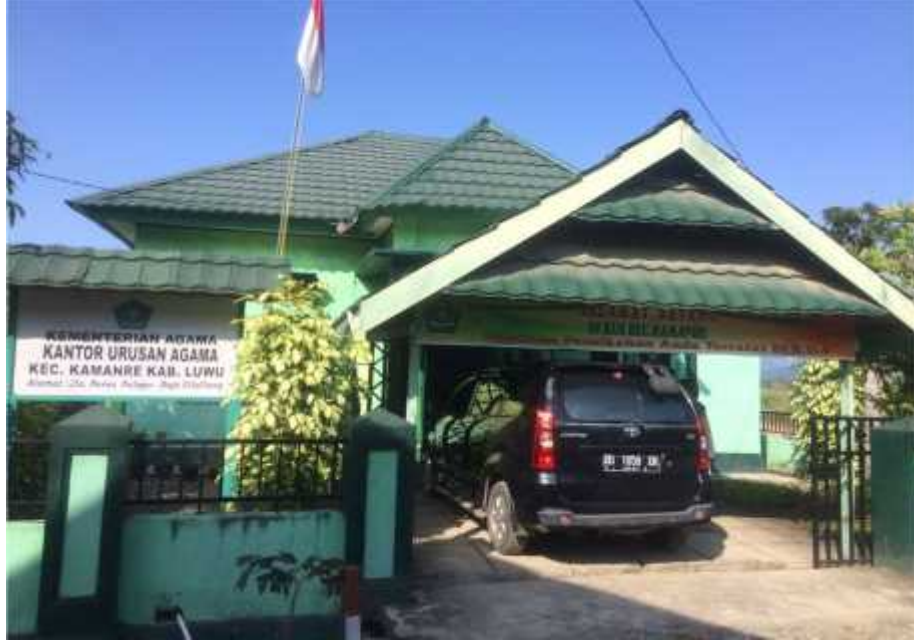
Kantor KUA Kelurahan Cilalang, Kecamatan Kamanre, Kabupaten Luwu