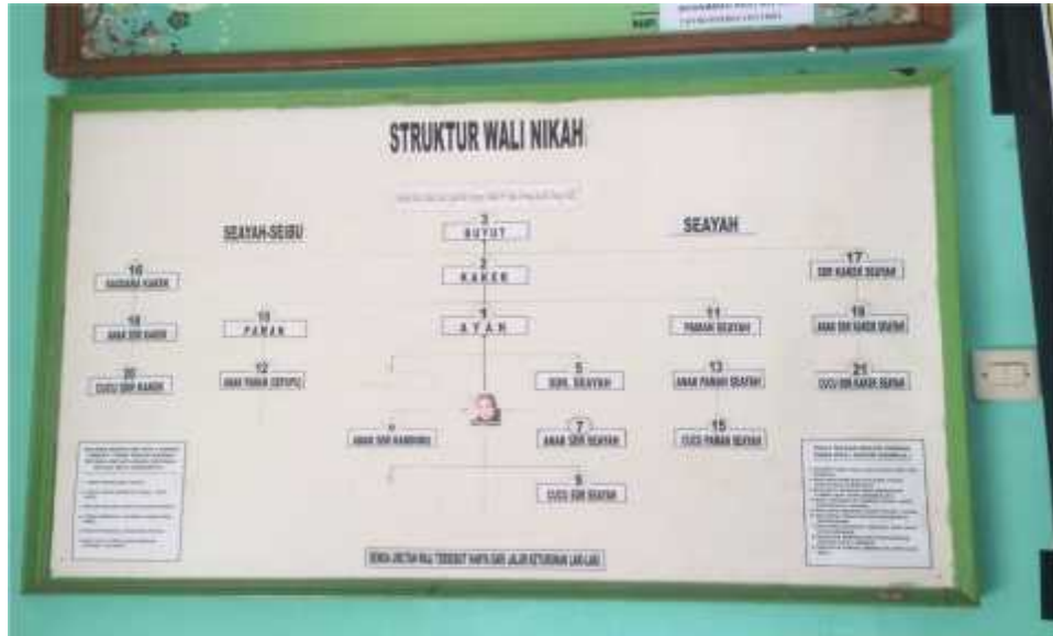
Struktur Wali Nikah KUA, Kecamatan Kamanre, Kabupaten Luwu