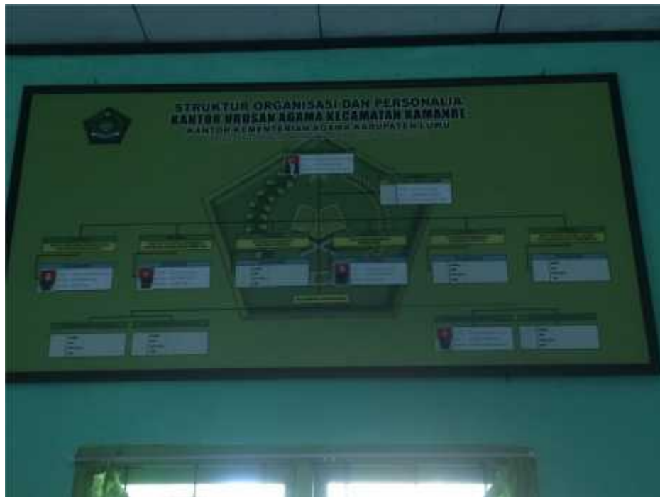
Struktur Organisasi KUA, Kecamatan Kamanre, Kabupaten Luwu