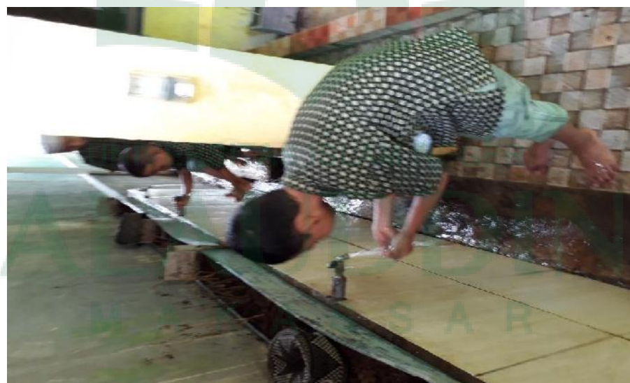
Documen SDIT Ma'arif