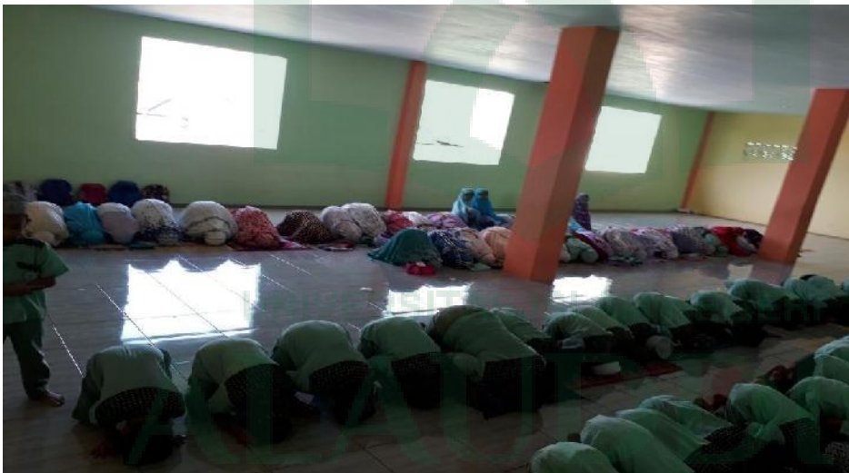
Documen SDIT Ma'arif