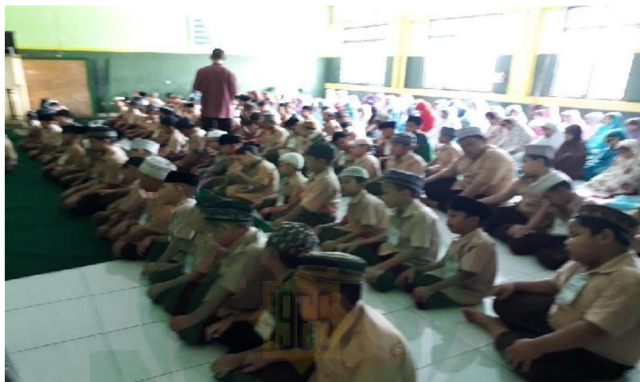
Documen SDIT Ma'arif