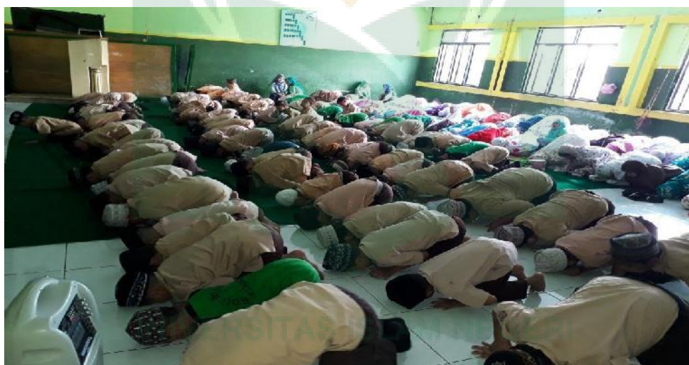
Documen SDIT Ma'arif