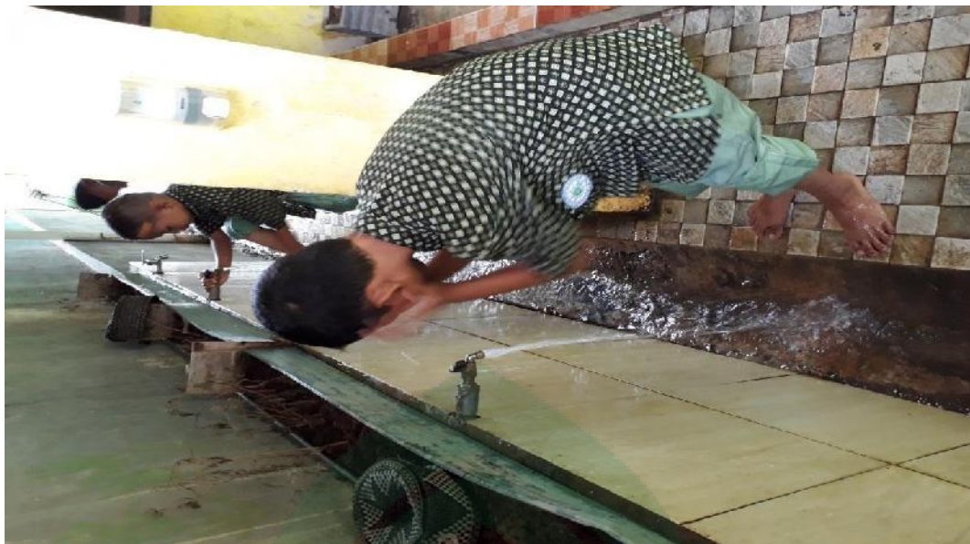
Documen SDIT Ma'arif