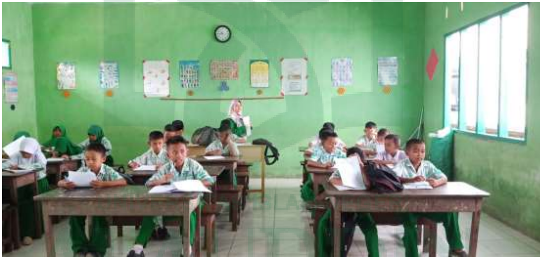
Dokumentasi 1: Tes penggunaan kosakata peserta didik kelas IV MI Muhammadiyah Romang Lompoa Kecamatan Bajeng Barat Kabupaten Gowa.