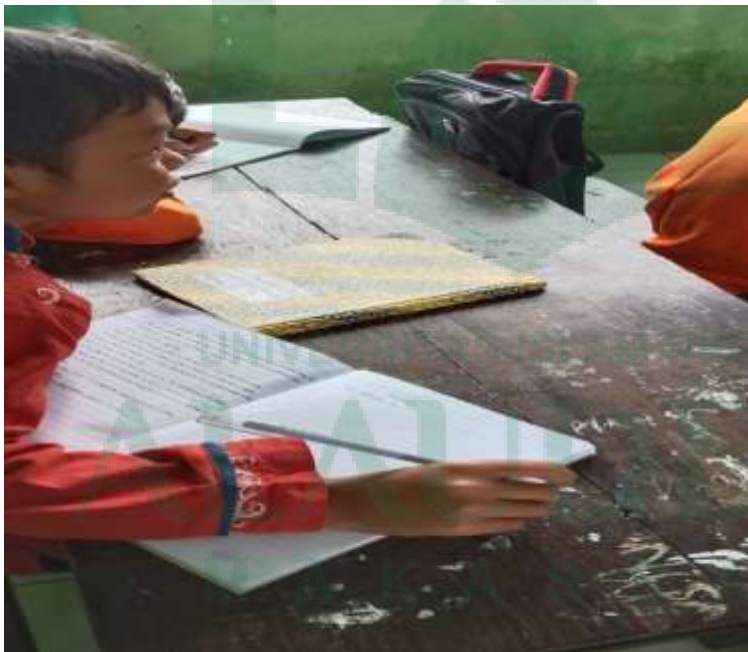
Dokumentasi 2: tes kemampuan menulis cerita peserta didik kelas IV MI Muhammadiyah Romang Lompoa Kecamatan Bajeng Barat Kabupaten Gowa.