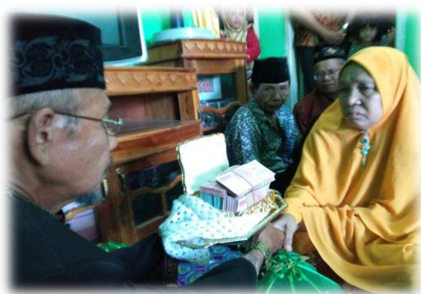
Pemberian Uang Panaik