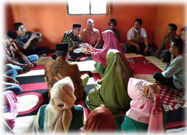
Prosesi A'panai Leko'