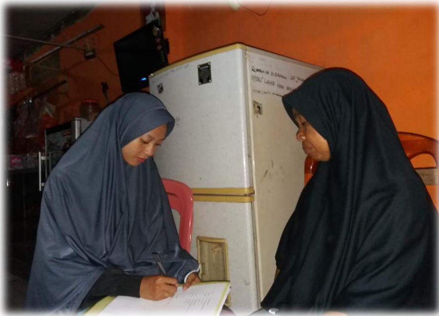
Peneliti Sedang mewawancarai narasumber