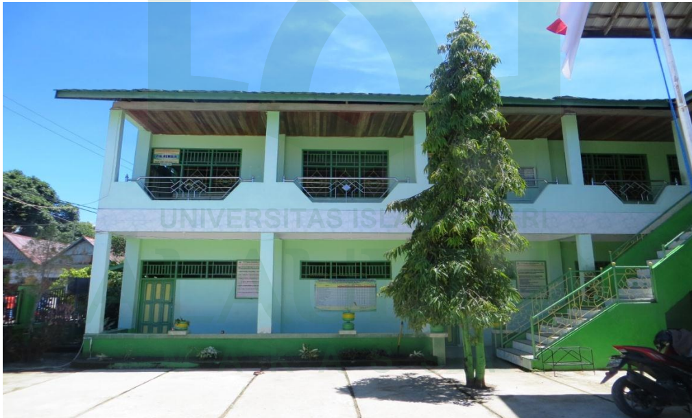
Ruangan Kelas Para Santri