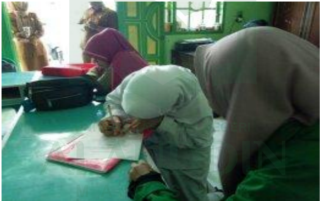
Wawancara Dengan Santriwati Mujahida