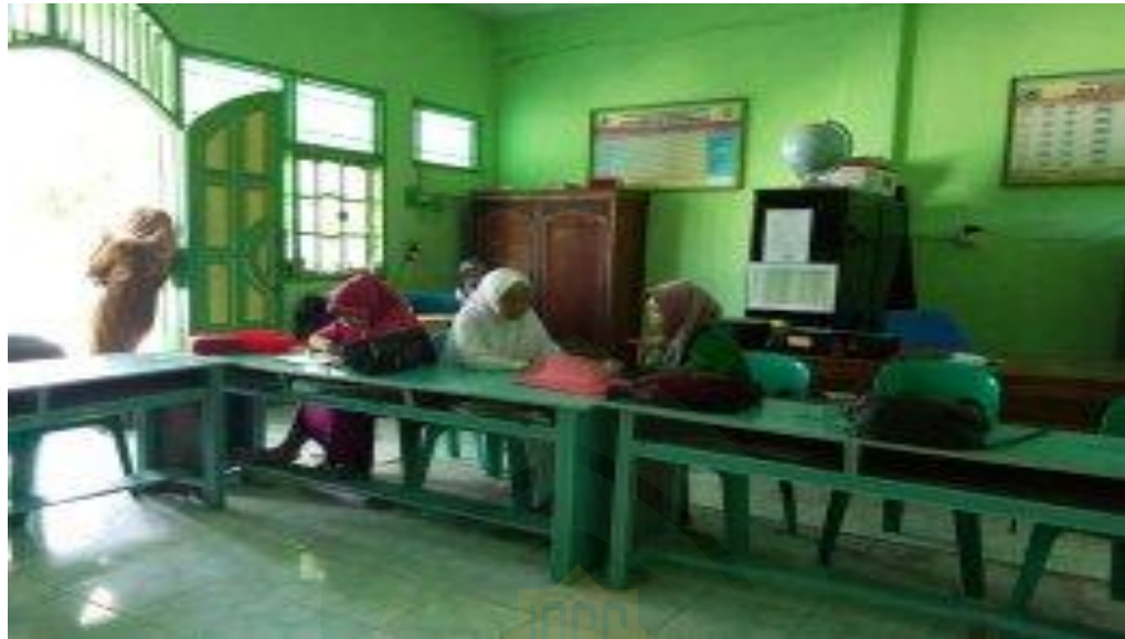
Wawancara Dengan Santri