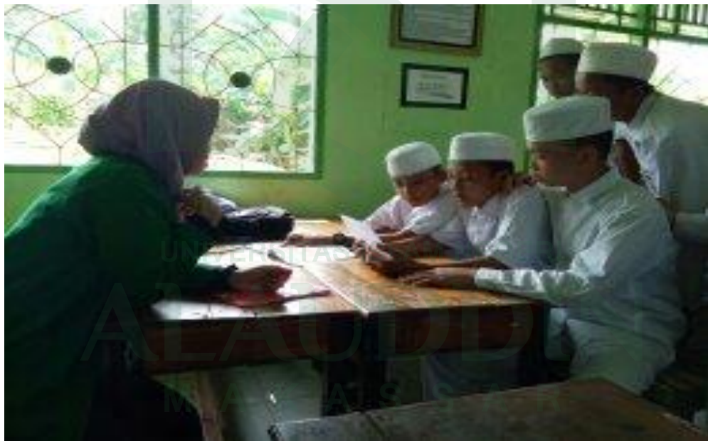
Wawancara Dengan Para Santri