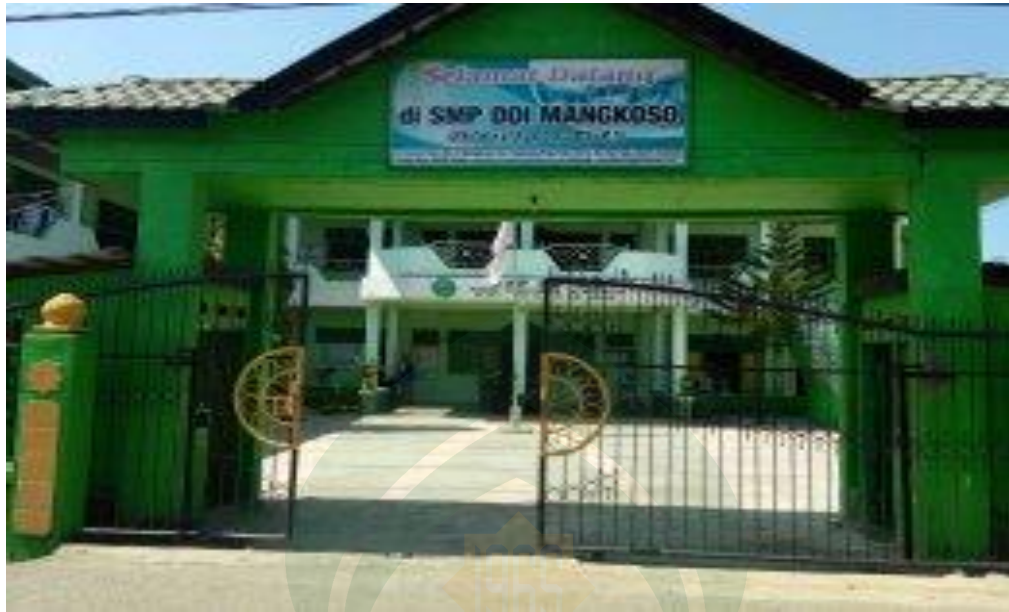
Madrasah DDI Mangkoso Barru Kec.Soppeng Riaja Kab.Barru