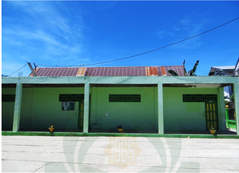
Ruangan Para Santri Wati

UNIVERSITAS ISLAM NEGERI ALAUDDIN M A K A S S A R