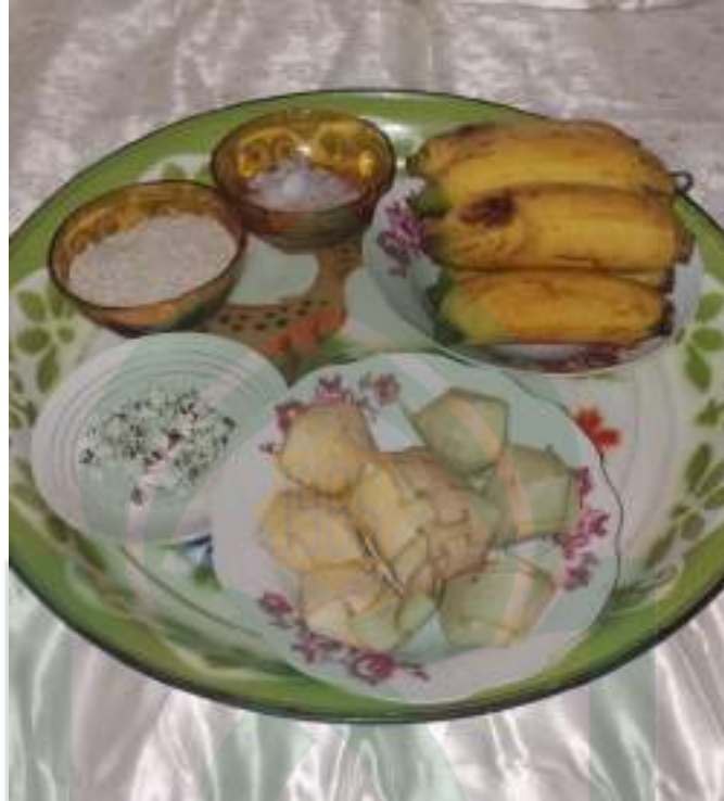
Persiapan Malam Taralu (Mapaccing)