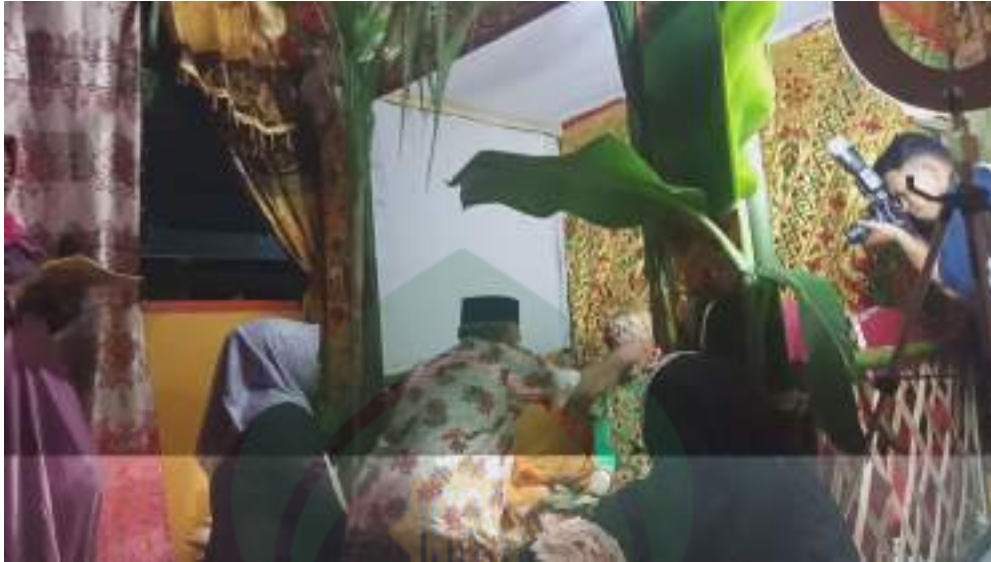
Wawan Cara dengan Tokoh Masyarakat