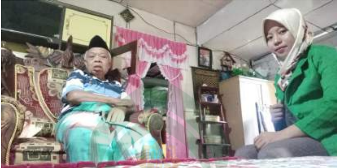
Prosesi Baung Ombongang