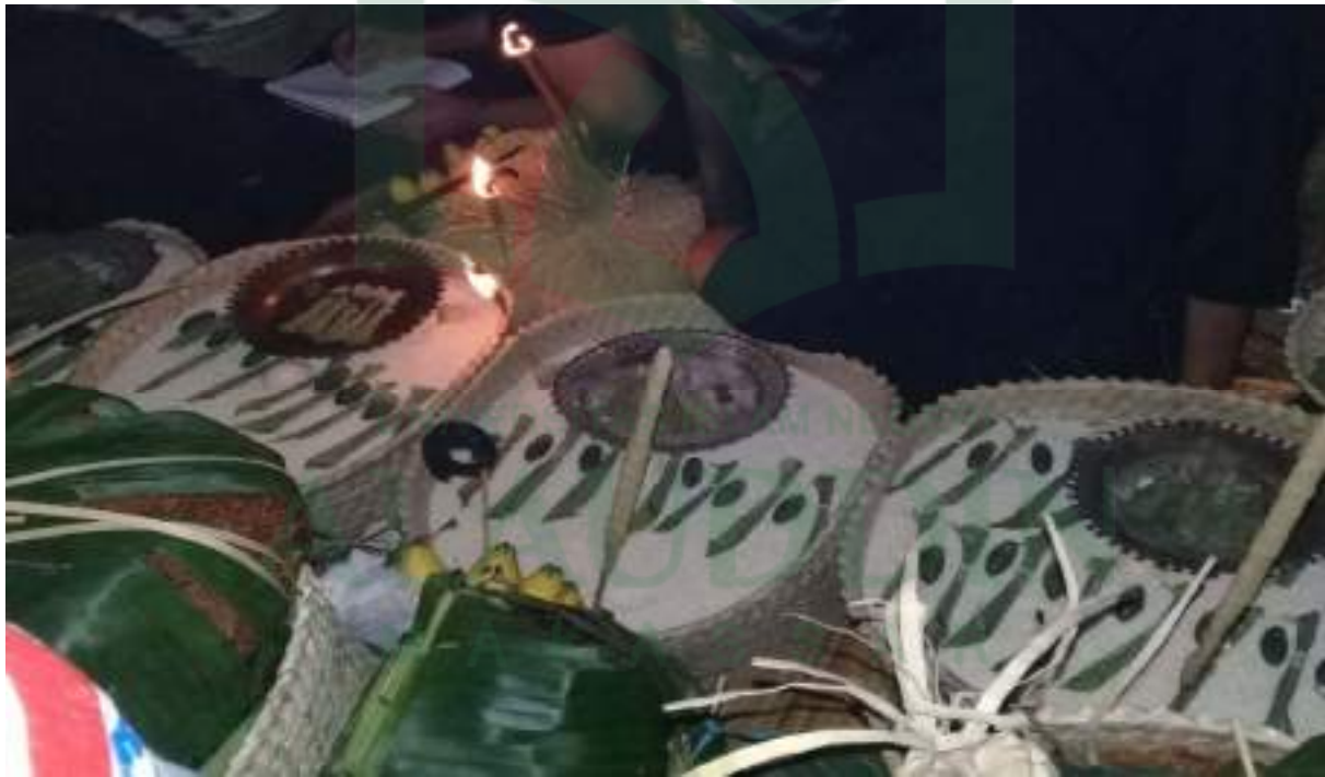
Beras Untuk Persiapan Katterang