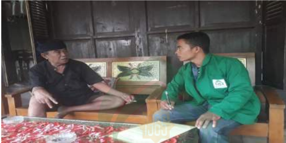
Warga Tana Toa