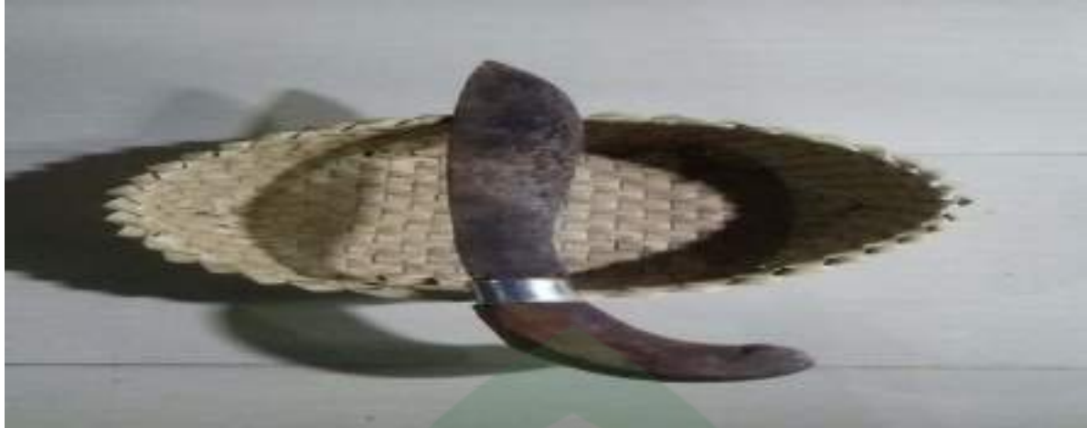
Parang ( Alat Untuk pakkatterang)