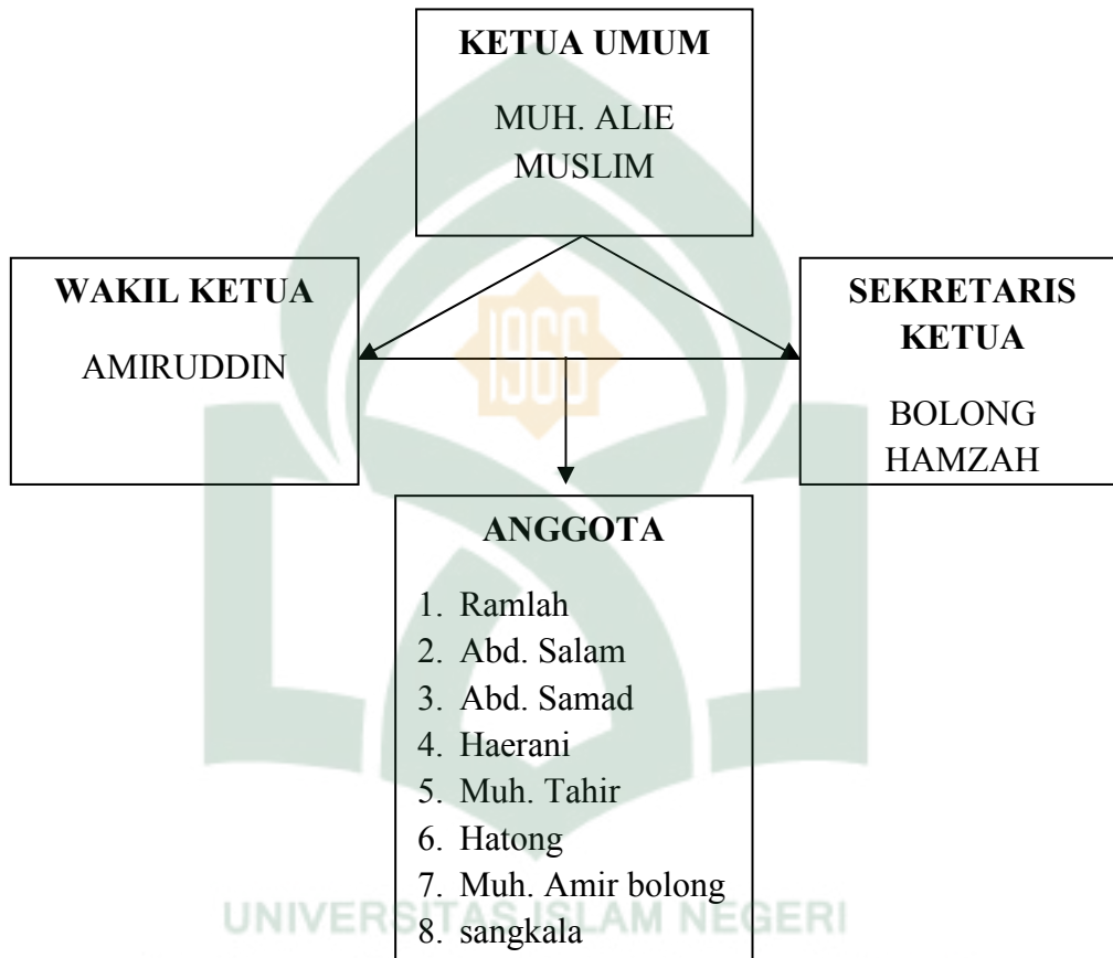
Tabel 3. Nama Badan Permusyawaratan Desa (BPD) Tanah Towa Periode 2016-2022.