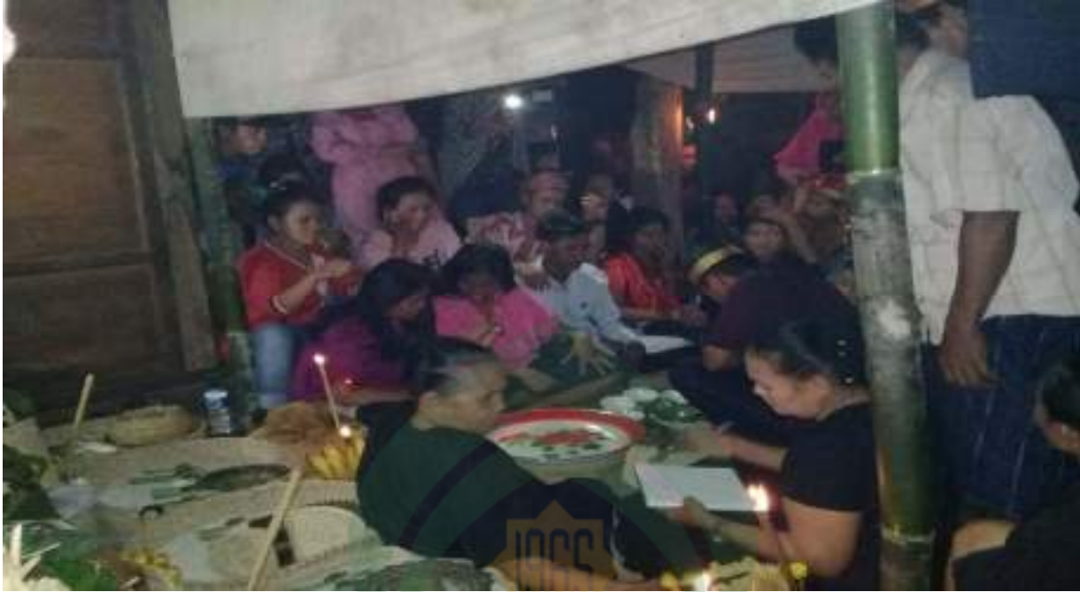
Proses Pada Saat Katterang