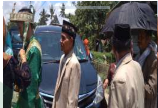
Menyiram kaki calon pengantin laki-laki