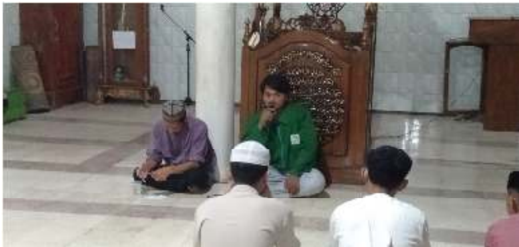
Gambar 6. Peneliti memberikan motivasi kepada santri pada sat training dakwah.