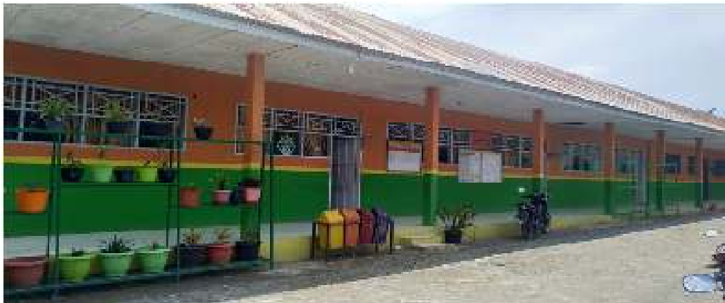
Gambar 4. Gedung kantor Madrasah Tsanawiyah, kantor Madrasah Aliyah, dan kantor Pimpinan Pondok Pesantren Al-Mubarak DDI Tobarakka tingkatan Madrasah Aliyah.