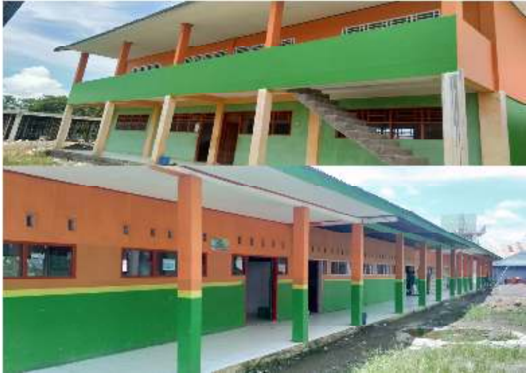
Gambar 3. Gedung kelas Pondok Pesantren Al-Mubarak DDI Tobarakka tingkatan Madrasah Aliyah.