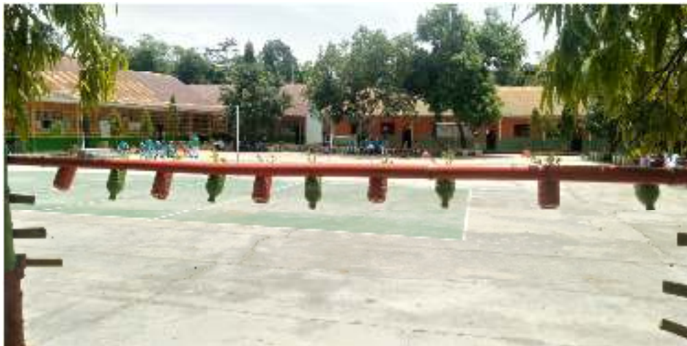
Gambar 2. Lapangan dan gedung kelas Pondok Pesantren Al-Mubarak DDI Tobarakka tingkatan Madrasah Tsanawiyah.