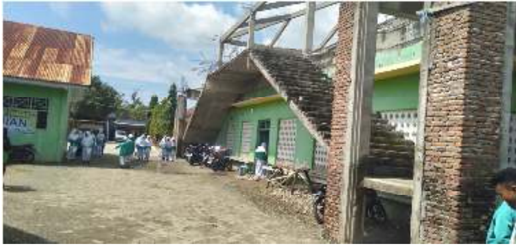
Gambar 7. Masjid Pondok Pesantren Al-Mubarak DDI Tobaraka.