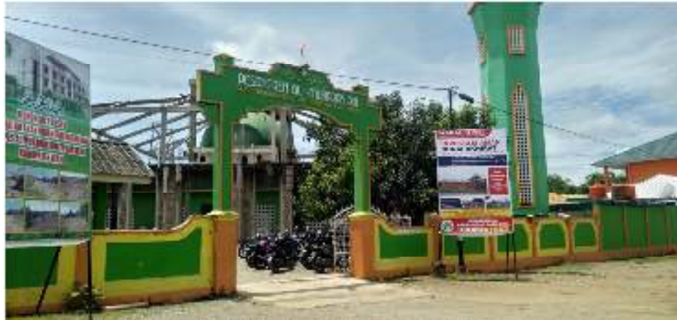
Gambar 1. Bagian depan Pondok Pesantren Al-Mubarak DDI Tobarakka.