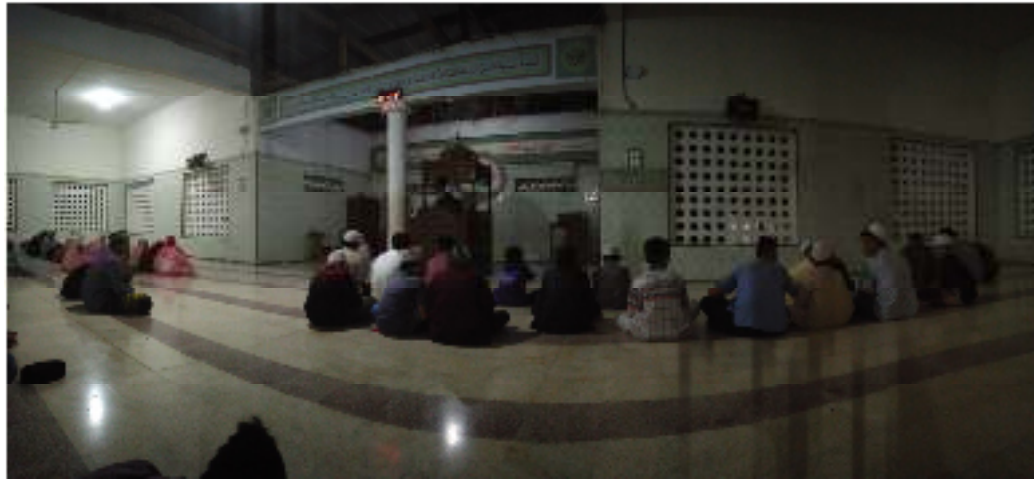
Gambar 5. Kegiatan training dakwah santri Pondok Pesantren Al-Mubarak DDI Tobarakka tingkatan Madrasah Aliyah.